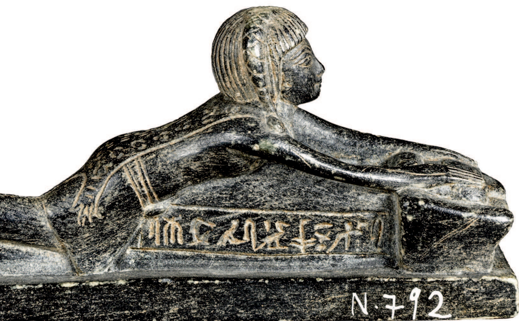
Prêtre « bouclé » représenté en meunier

« Anastylose » est un terme qui, en archéologie, désigne une technique permettant de reconstituer un monument ruiné en utilisant les fragments qui lui appartiennent et trouvés habituellement sur le site même où ce monument a été érigé. Les mythes égyptiens ne nous étant guère parvenus sous forme de récits continus, il est tentant d'utiliser une technique similaire pour les reconstituer : ces fragments, que l'on nomme mythèmes, sont glanés dans les textes de tous genres et toutes les époques. Deux exemples d'anastylose mettent la méthode en pratique.