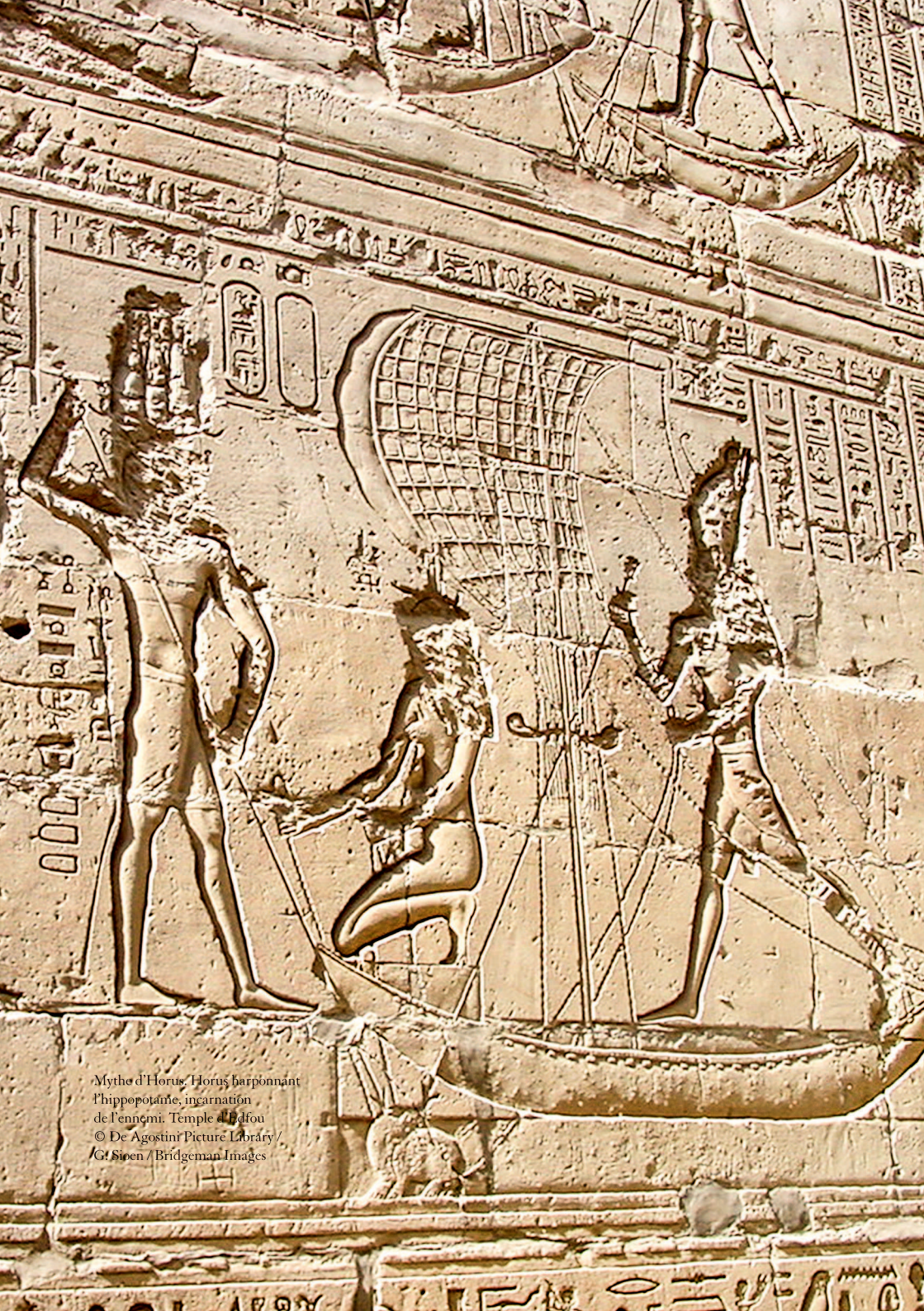
Mythe d'Horus, Horus barbonnant l'hippopotame, incarnation de l'ennemi. Temple d'Edfou