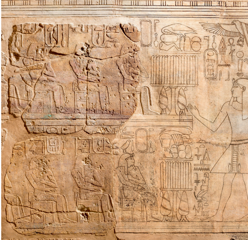
Chambre des ancêtres