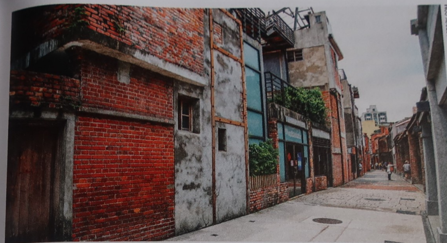
Vieille rue de Bopiliao.

Lane 173, Kangding Road, Wanhua District ☎ +886 2 2302 3199 www.bopiliao.taipei bopiliao@redhouse.org.tw