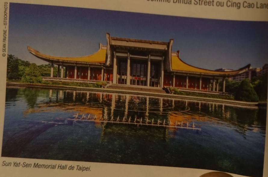
Sun Yat-Sen Memorial Hall de Taipei.

Lane 224, Xichang Street, Wanhua District M° Longshan Temple Partie intégrante du vieux Taipei, on vient y acheter du thé ou des plantes médicinales depuis 1738. Sur 500 m, cette petite ruelle qui longe le temple de Longshan porte plusieurs surnoms comme Dihua Street ou Cing Cao Lane.