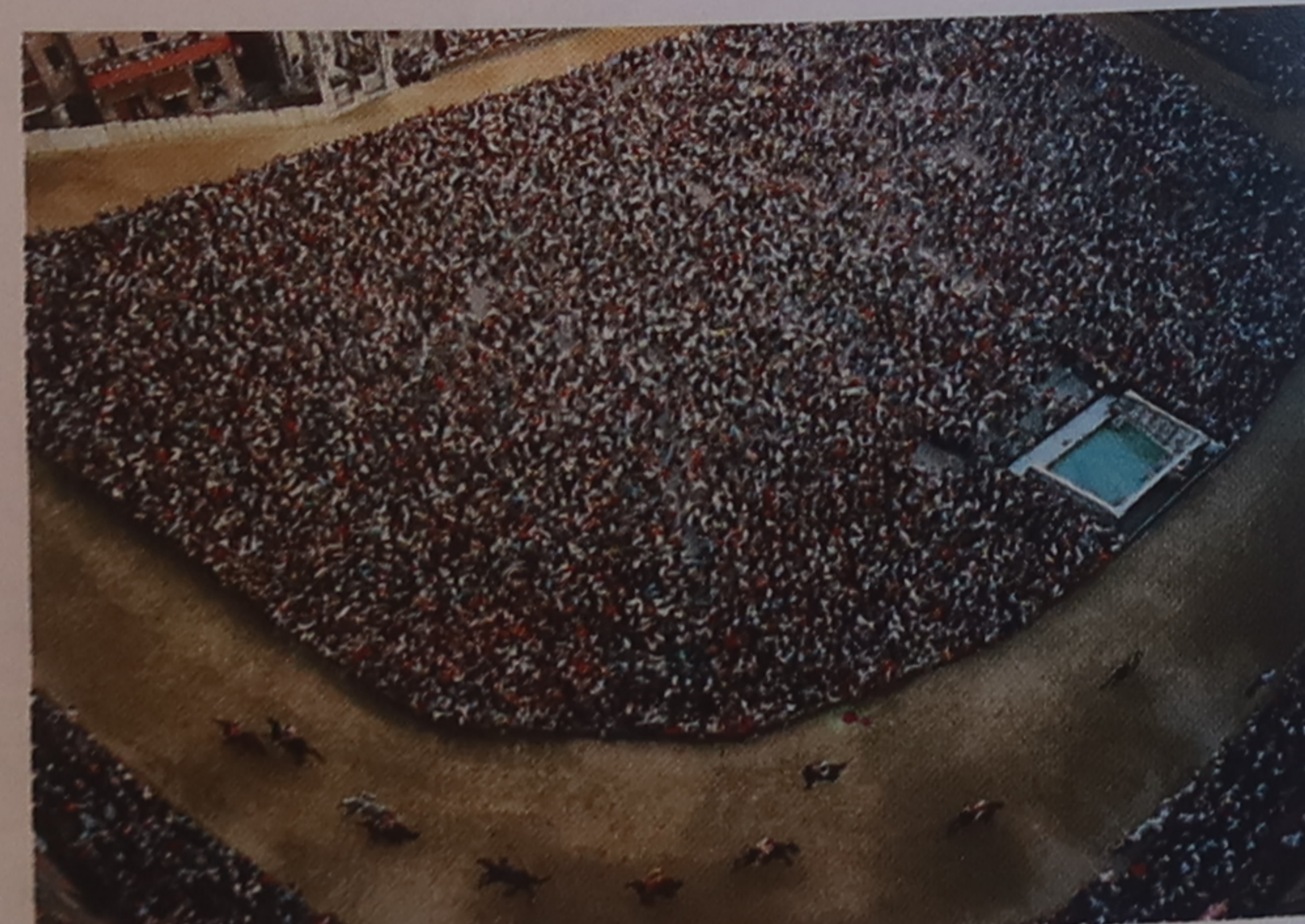
Vue du Campo pendant une course