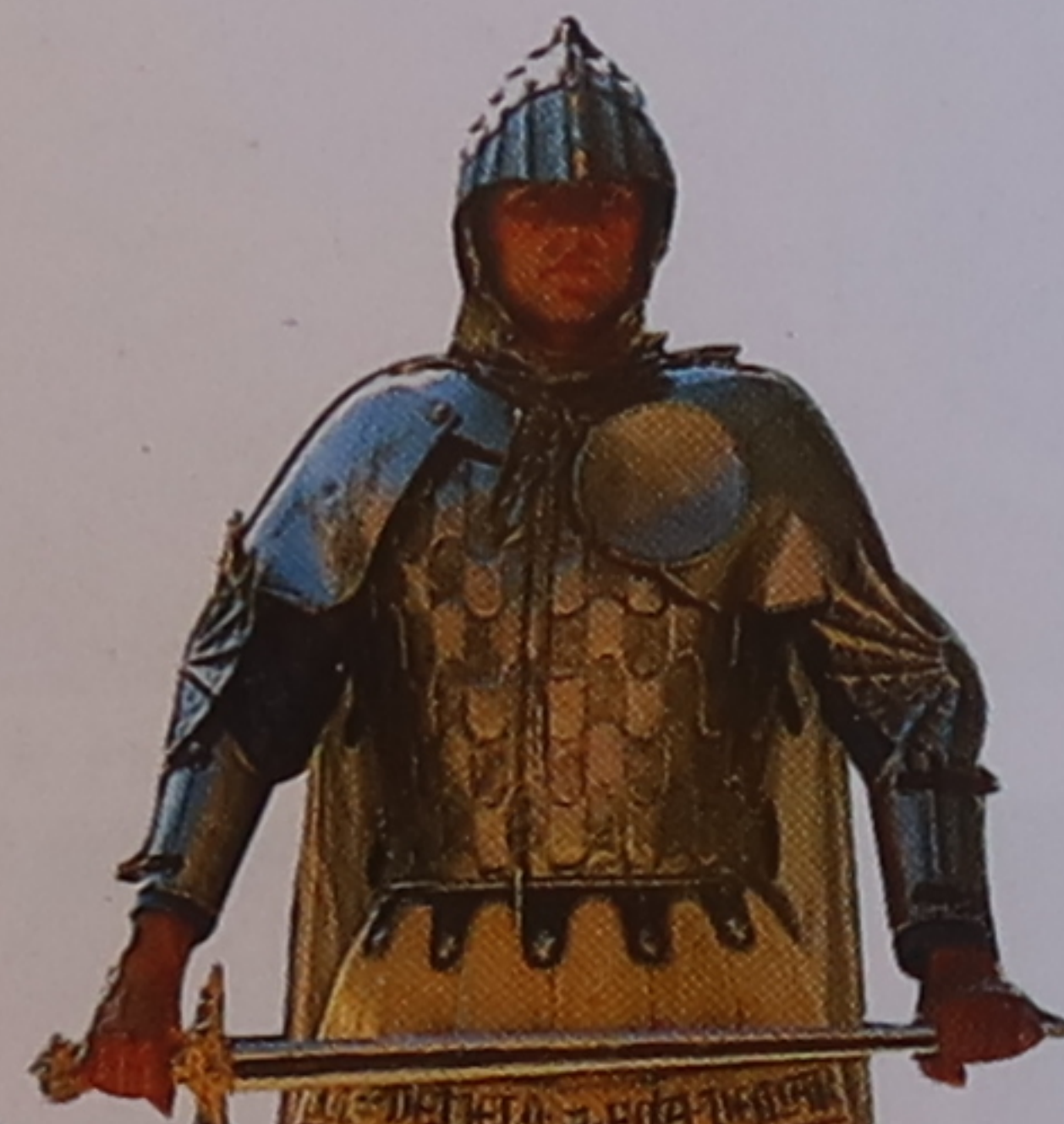
Chevalier du Moyen Âge Les costumes traditionnels portés dans le défilé sont confectionnés avec art.