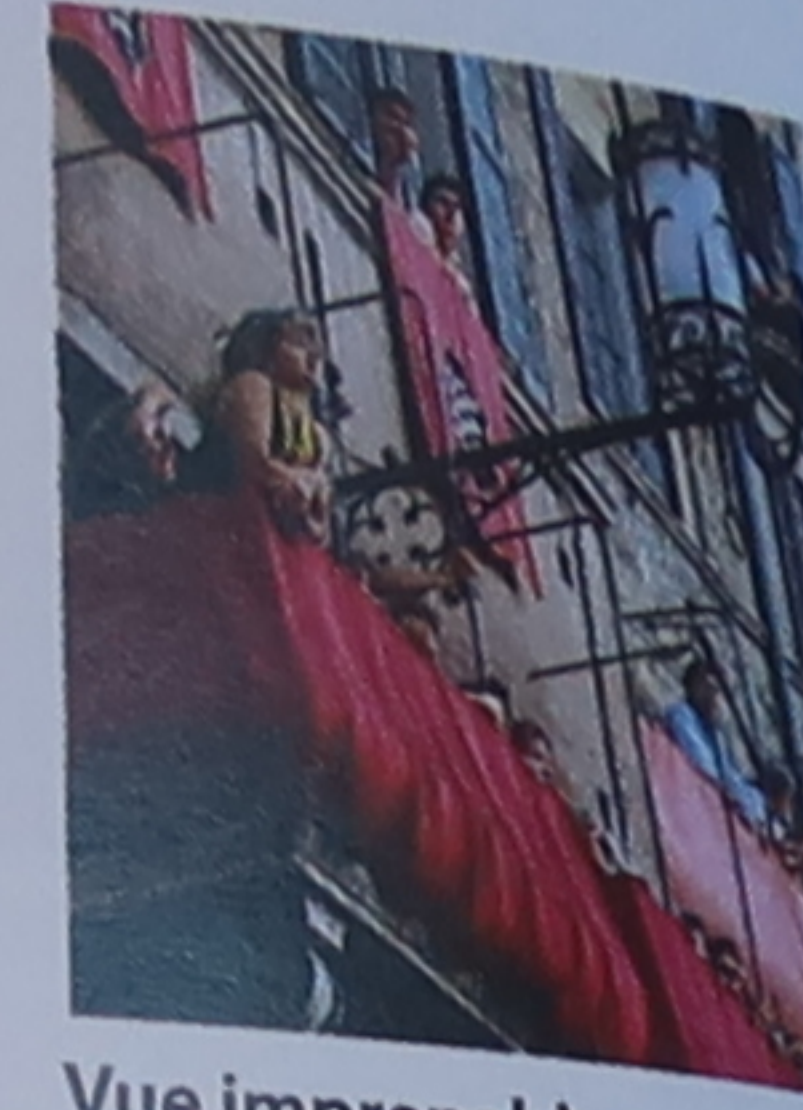
Vue imprenable D'aussi bonnes places valent très cher.

La plus célèbre manifestation de Toscane doit son nom à la bannière ( palio ) remportée par le vainqueur. Opposant dix des 17 contrade (quartiers) de la ville, tirées au sort chaque année, cette course de chevaux se déroule le 2 juillet (palio di Provenzano) et le 16 août (palio dell'Assunta) sur la piazza del Campo (p. 222). Attestée dès 1283, elle pourrait être bien plus ancienne et tirer ses origines de l'entraînement des soldats romains. Lors du défilé en costumes qui précède, les porte-étendards rivalisent d'adresse. Après la course, toute la ville est en fête.