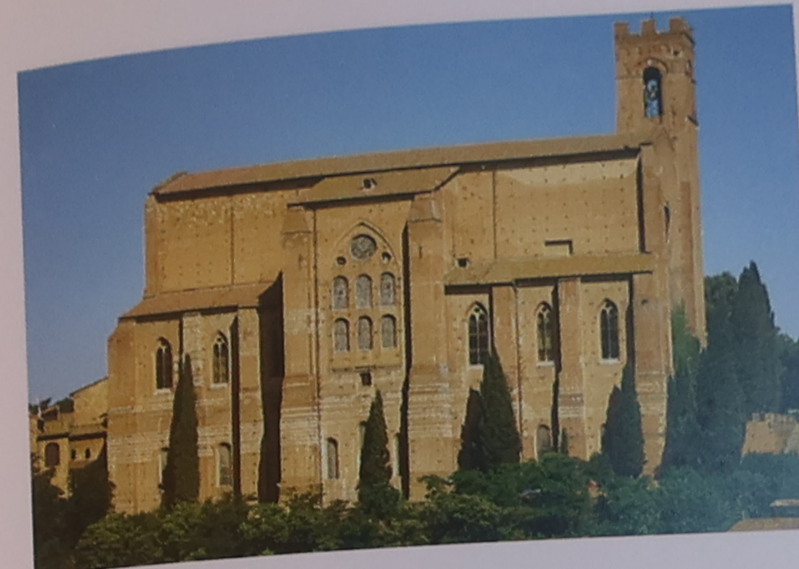
La façade de San Domenico