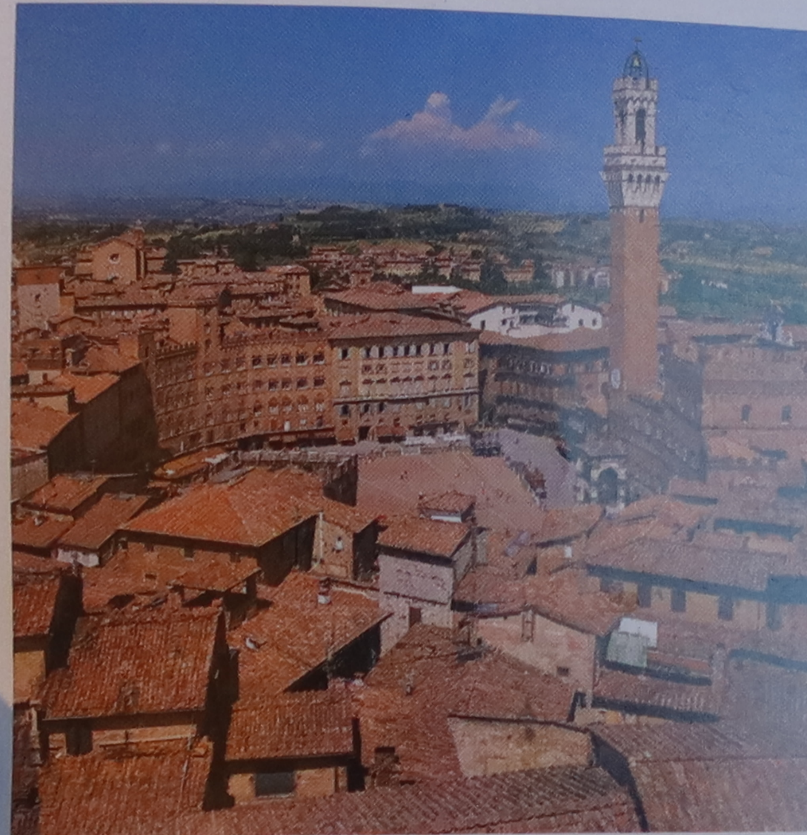
Vue aérienne de la piazza del Campo et de ses palais

Les édifices qui entourent la piazza del Campo, le cœur géographique et historique de Sienne, rappellent l'âge d'or que connut la cité au xii e siècle, quand elle vivait du commerce du safran et des étoffes. Partisane des gibelins, elle soumit en 1260 sa rivale Florence, qui soutenait les guelfes. Sienne connut alors une extension sans précédent, se couvrant de palais et d'églises, mais la peste de 1348 emporta un tiers de sa population. Deux siècles plus tard, elle dut se plier à l'autorité du gouvernement des Médicis et resta depuis lors figée dans son magnifique décor médiéval.