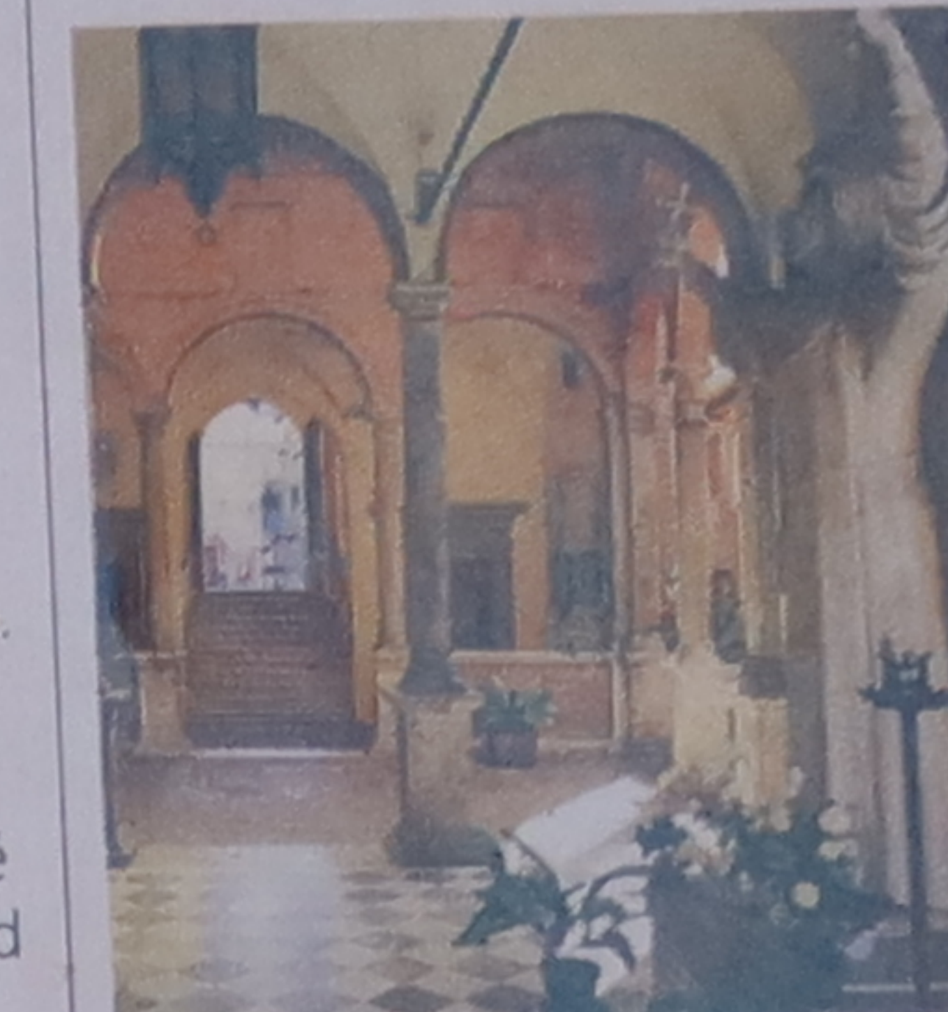
Cloître de la casa di Santa Caterina

les fresques de Domenico di Bartolo montrent des scènes de moines soignant les malades.