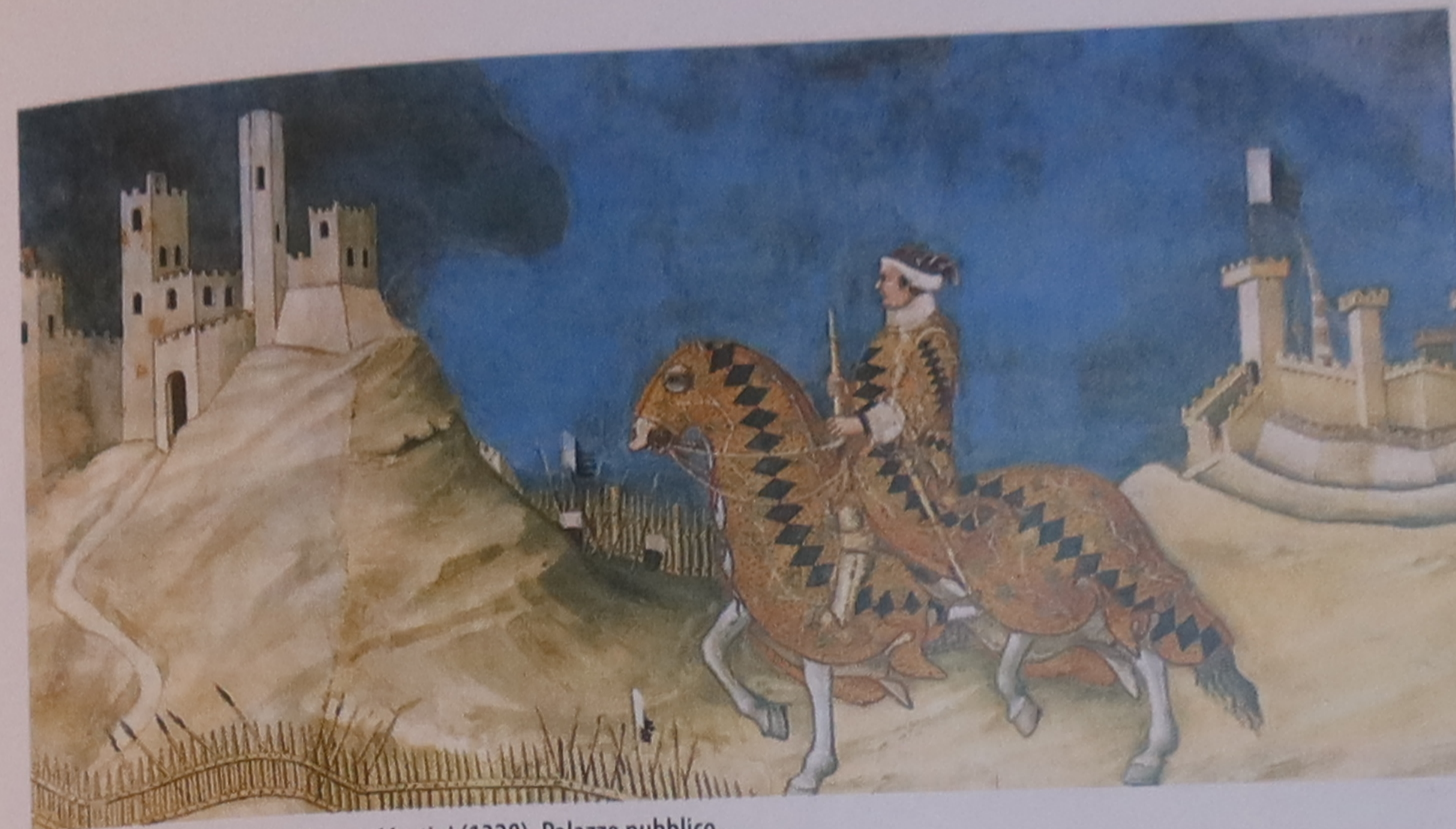
Guidoriccio da Fogliano de Simone Martini (1328), Palazzo pubblico

C'est dans la sala della Pace que se trouvent les allégories d'Ambrogio Lorenzetti. Ces œuvres, achevées en 1338, constituent le plus vaste cycle de fresques à sujet séculier du Moyen Âge. La cité florissante des Effets du Bon Gouvernement à la ville et à la campagne (p. 50-51) s'y oppose à la ruine causée