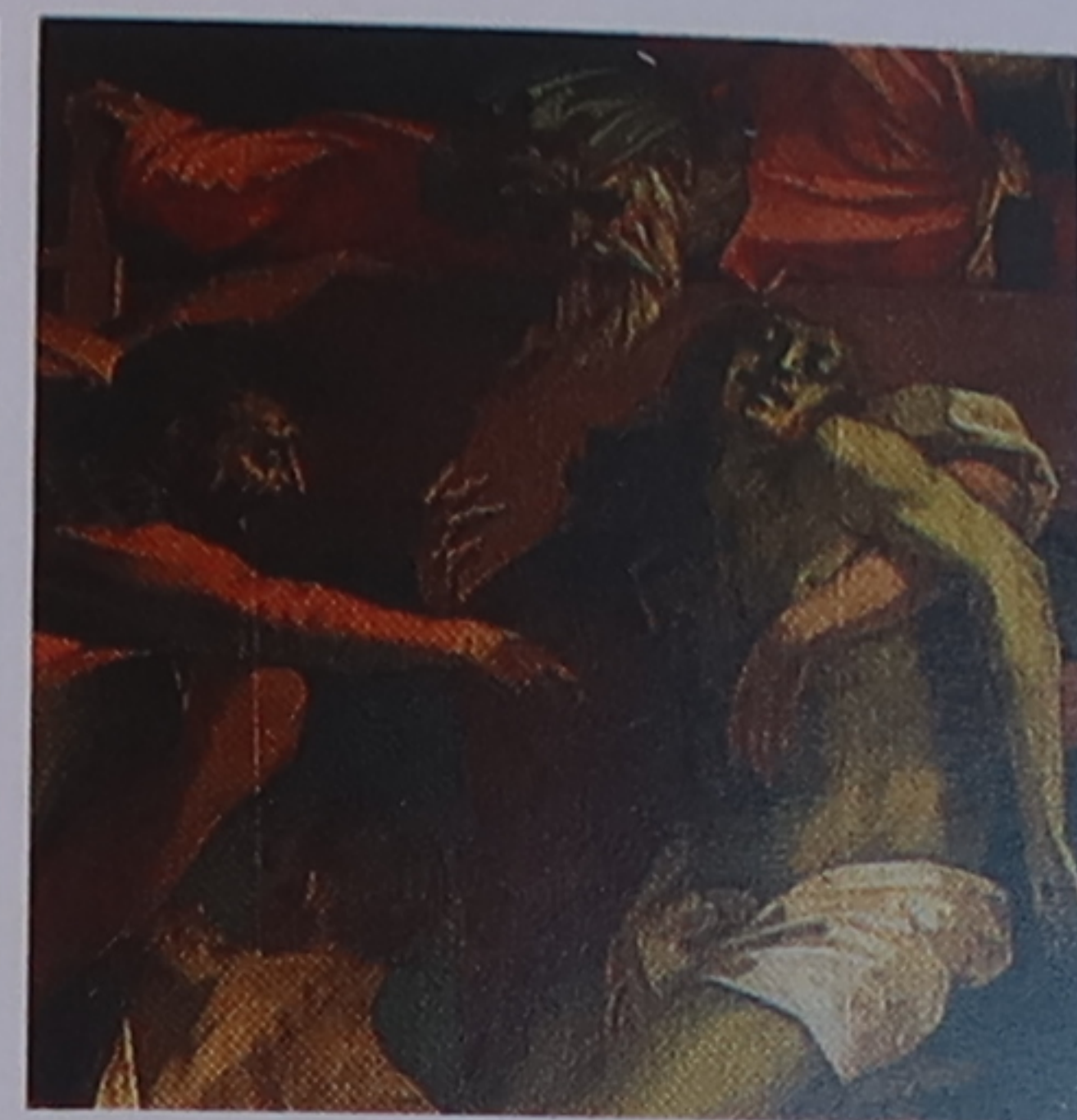
Détail de La Déposition (1521), œuvre de Rosso Fiorentino

ainsi, car elle évoquait pour lui l'ombre projetée par un homme dans la lumière du soir. On suppose qu'il s'agit d'une statuette votive du III e siècle av. J.-C., mais le personnage ne porte ni vêtement ni bijou permettant de l'identifier avec certitude. Déterrée en 1879 par un fermier, cette œuvre surprenante aurait pu ne jamais nous parvenir, car elle servit longtemps de tisonnier.