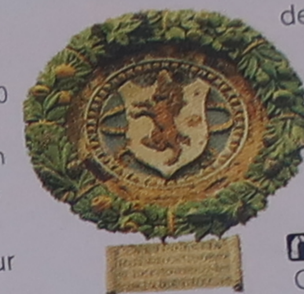
Escusson du palazzo dei Priori

Sobre édifice qui aurait servi de modèle au Palazzo Vecchio de Florence (p. 82-83), le palazzo dei Priori (XIII e siècle), ou palais des Prieurs, domine cette belle place médiévale qui s'étend au centre de la ville. Depuis la salle du Conseil, la vue porte jusqu'au théâtre romain. La torre