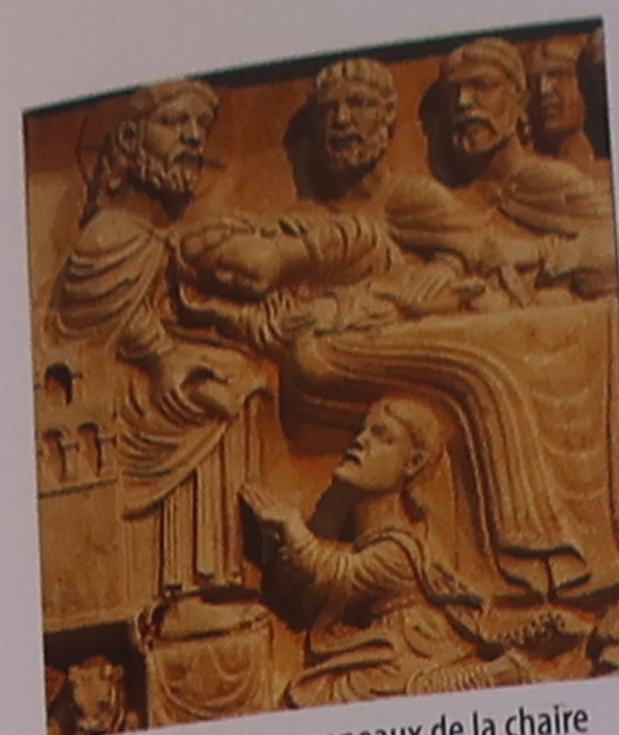
Détail de l'un des panneaux de la chaire du Duomo

reliefs de marbre remontant à la fin du XII e siècle et au début du XIII e . Face à la nef, une belle Cène attribuée à Guglielmo Pisano fait preuve d'un humour pour le moins étonnant. Vous pourrez notamment y observer un monstre qui mord la cheville de Judas. Non loin, l'autel de l'une des chapelles latérales comprend une Annonciation (1497) exécutée par Mariotto Albertinelli (1474-1515).