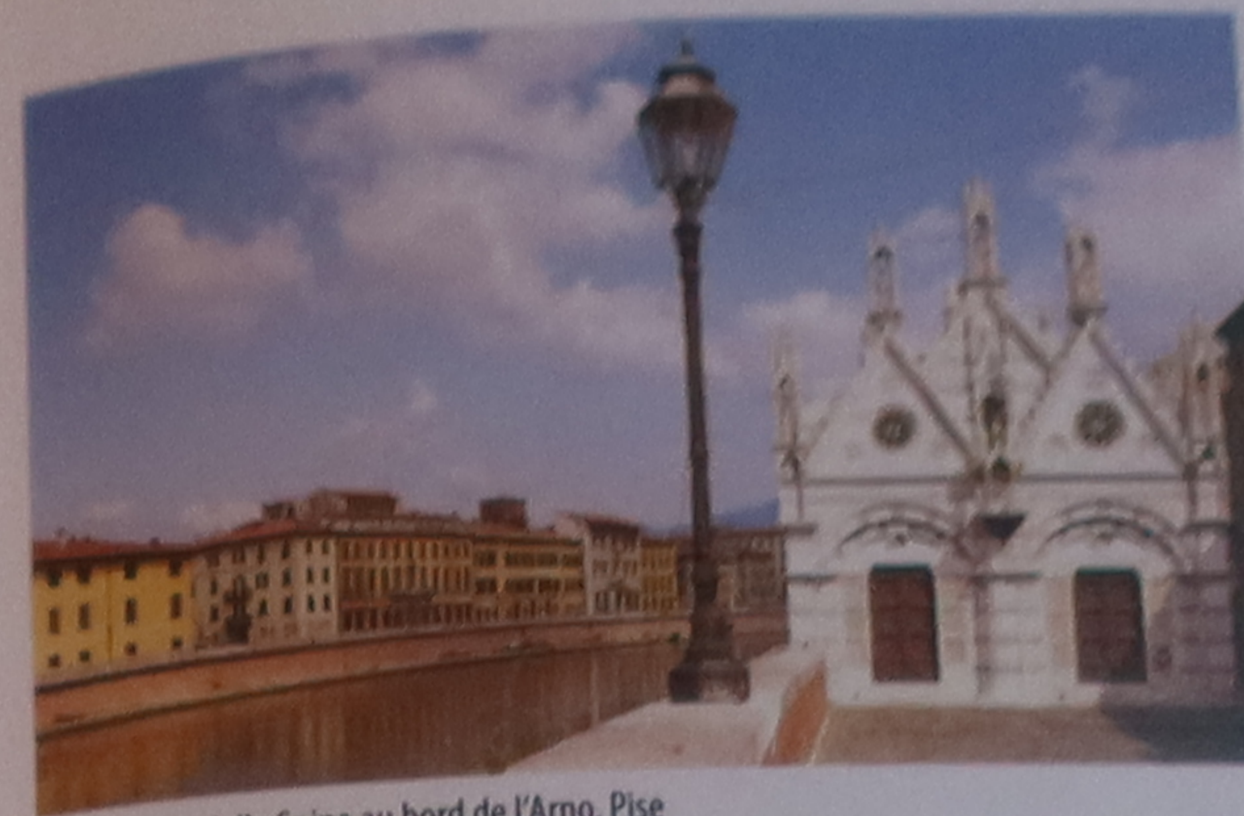
Santa Maria della Spina au bord de l'Arno, Pise

L'étage qui renferme les cloches est d'un diamètre plus réduit que les sept autres. Ajouté en 1350, il porta la hauteur totale de la tour à 54,5 m.