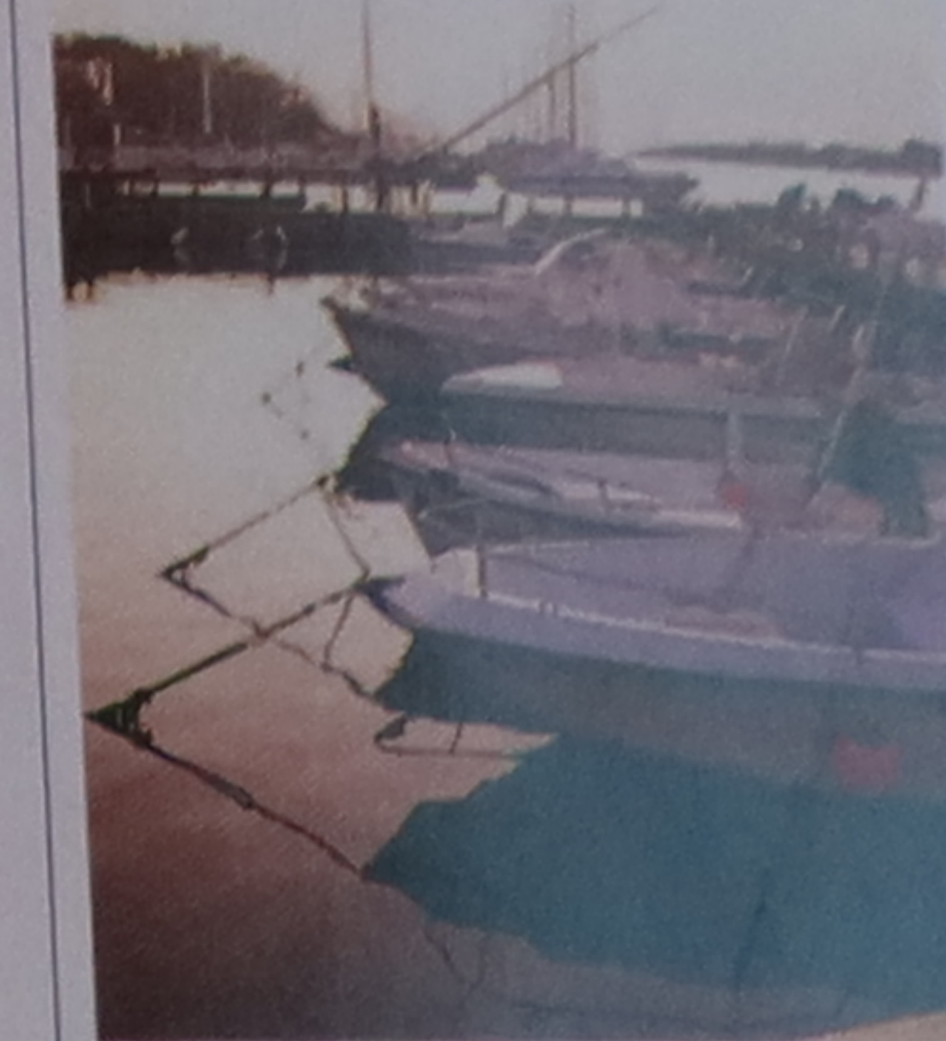
Bateaux au quai, Marina di Pisa

nord de la Toscane. Sangliers et cerfs peuplent les pinèdes et les marais de la réserve. Le centre des visiteurs offre des balades à pied, à vélo ou à cheval.