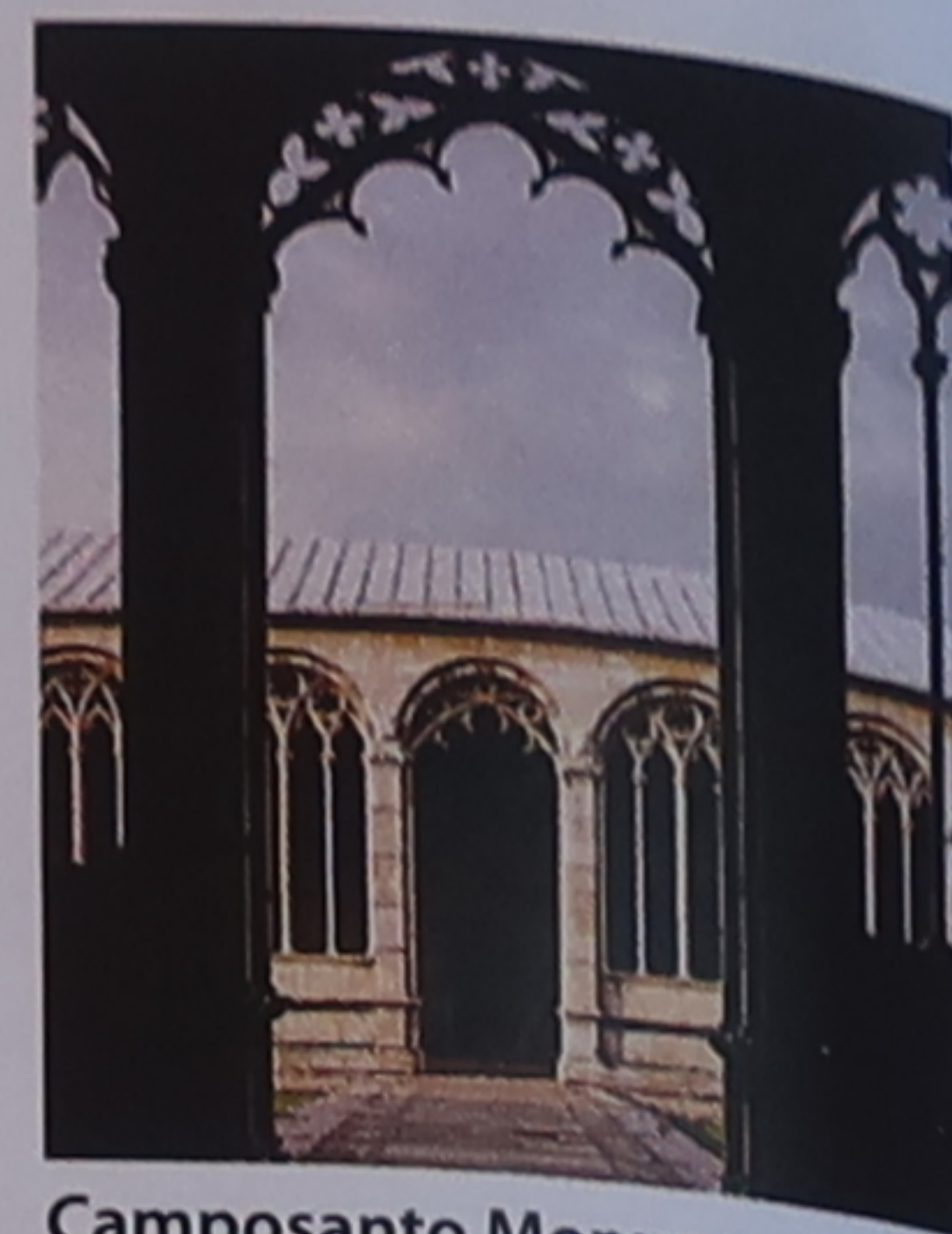
Camposanto Monumentale L'immense cimetière renferme des sarcophages antiques et paléochrétiens.

Nicola Pisano acheva en 1260 cette grande chaire en marbre, sculptée de scènes de La Vie du Christ .