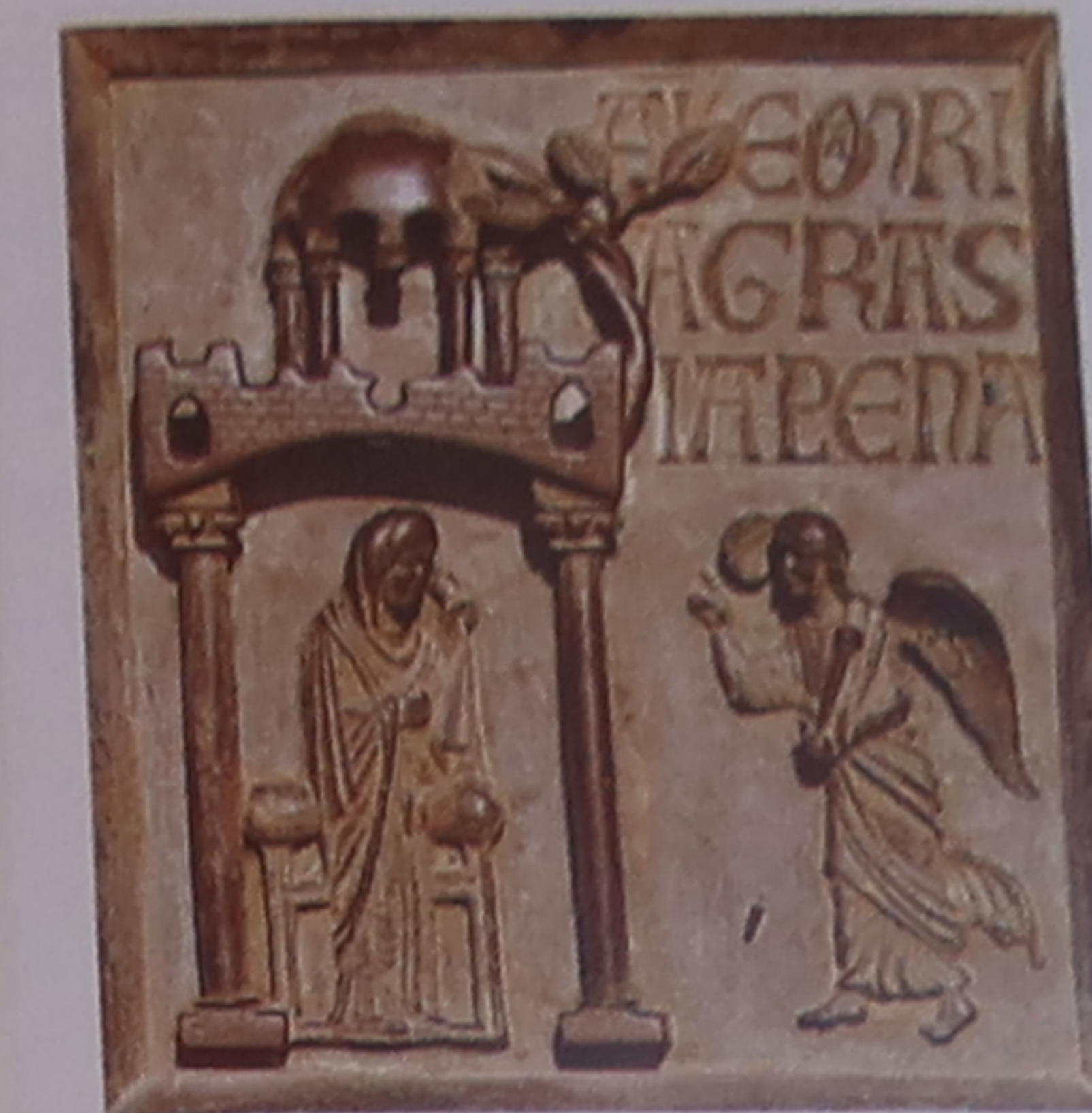
★ Portale di San Ranieri D'influence byzantine, les panneaux en bronze de la porte du transept sud, attribués à Bonanno Pisano, représentent La Vie du Christ .