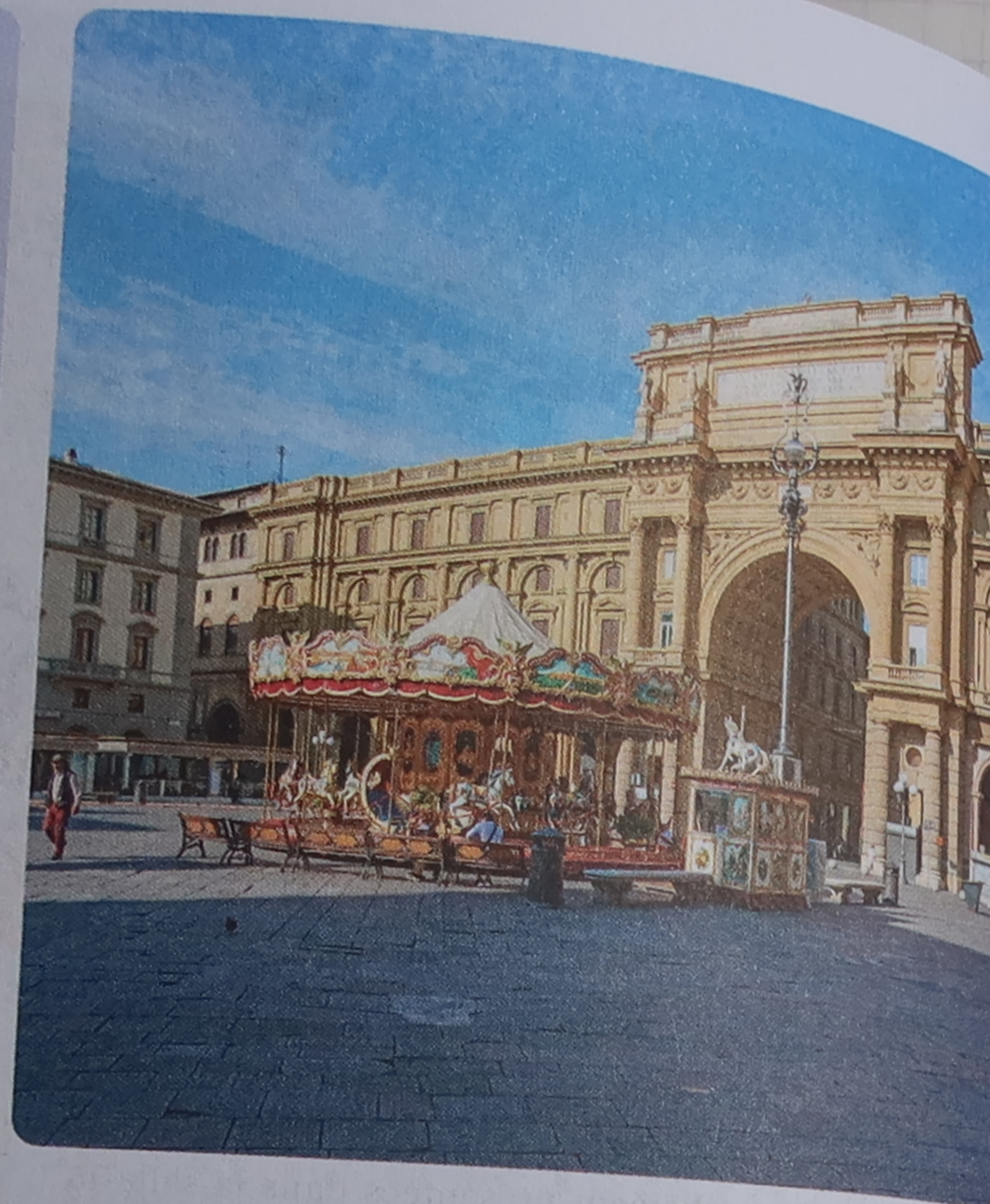
Piazza della Repubblica

Tout Florence attend avec impatience la réouverture du "couloir de Vasari", une galerie couverte de 760 m de longueur commandée en 1565 à Giorgio Vasari par le grand-duc Côme I er afin de relier le Palazzo Vecchio au Palazzo Pitti via les Offices et de permettre aux Médicis de circuler en toute sécurité et discrétion d'un palais à l'autre. Depuis 2016, une vaste rénovation a été entreprise, la plus importante collection d'autoportraits du monde devant être déplacée et remplacée par des fresques ornant les murs extérieurs au XVI e siècle, ainsi que des statues antiques. La réouverture souvent repoussée devrait approcher (fin 2023 ou 2024 ?) et le billet d'entrée, qui devrait coûter 45 € (!), donnera accès à une expérience inédite entre vue panoramique sur Florence, documents historiques et œuvres d'art uniques.