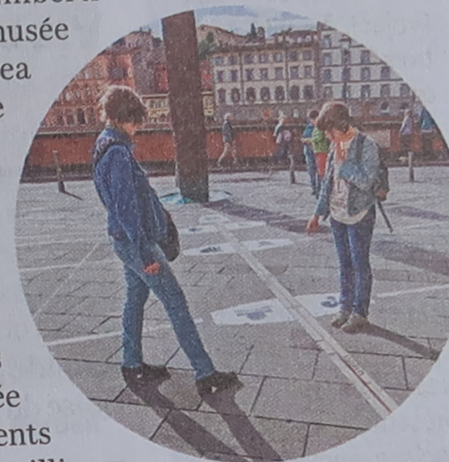
Cadran solaire, Piazza dei Giudici

Au bord de l'Arno, sur la Piazza dei Giudici , un cadran solaire géant permet de lire l'heure grâce aux ombres projetées au sol. Il a été dessiné à l'entrée de ce musée moderne dont les expositions interactives d'instruments scientifiques intéresseront petits et grands. Plus d'un millier d'appareils y sont exposés, les plus anciens rassemblés par Côme I er et les Médicis qui firent venir le grand scientifique pisan à Florence en 1610. De Galilée, on peut voir le télescope qui lui permit de découvrir les lunes de Jupiter, ainsi qu'un "sanctuaire" macabre où est conservé le majeur du célèbre astronome.