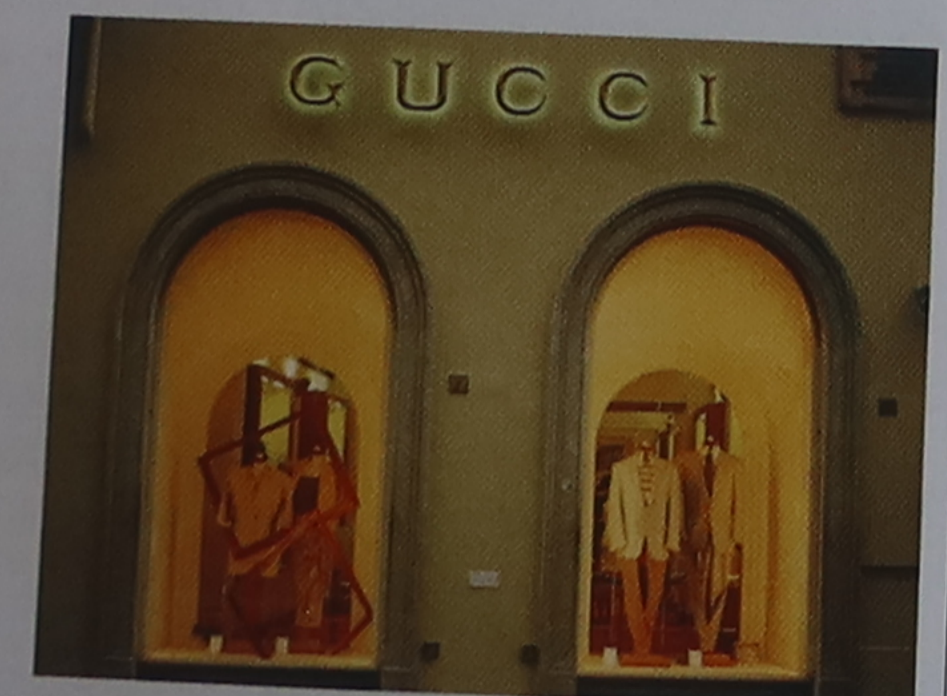
Boutique dans la très chic via de' Tornabuoni

Édifiée en 1935, la stazione di Santa Maria Novella ① (p. 117), la gare centrale, est l'un des rares bâtiments modernes de Florence, ville largement dominée par une architecture médiévale et Renaissance. En partant de la belle horloge à affichage numérique (prototype inventé par les Italiens), située du côté sud de la gare, traversez la piazza della Stazione, puis tournez à gauche derrière la grande église paroissiale Santa Maria Novella ② (p. 114-115). En longeant les arcades de l'église, qui abritaient jadis les caveaux des nobles de Florence, vous arriverez sur la piazza di Santa Maria Novella ③. Au xvii e siècle, des courses de chariots s'y déroulaient ;