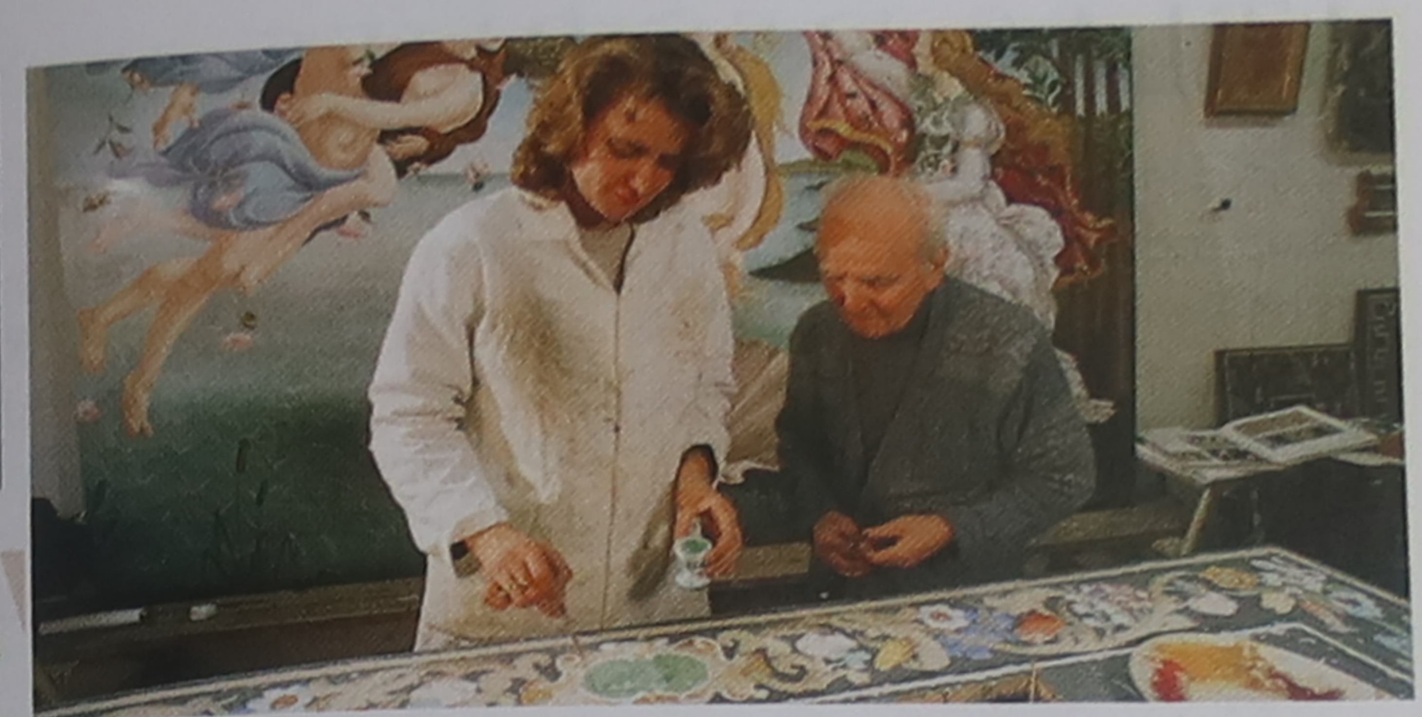
Boutique d'artisan dans l'Oltrarno

jusqu'à la piazza di Cestello ⑩, où la façade de l'église San Frediano in Cestello (p. 123) domine le fleuve. Retournez au borgo San Frediano en tournant à droite en direction de la piazza del Carmine ⑪. L'église Santa Maria del Carmine est célèbre pour sa cappella Brancacci (p. 130-131), agrémentée de superbes fresques de Masaccio, Masolino et Filippino Lippi. En quittant la place, prenez la via Santa Monaca (la rue la plus au sud), puis tournez à gauche dans la via dei Serragli. Dirigez-vous alors vers le fleuve mais, avant de l'atteindre, tournez à droite pour emprunter la via di Santo Spirito. Au n° 40 se dresse l'imposante silhouette de la torre de' Lanfredini ( xiii e - xiv e siècles). Du n° 5 au n° 13 s'étend la façade du palazzo Frescobaldi, siège du domaine viticole du même nom. Tournez dans la via de' Coverelli et marchez jusqu'à la piazza di Santo Spirito ⑬, le cœur de ce quartier bohème. Le bus n° 11 vous reconduira au Duomo.