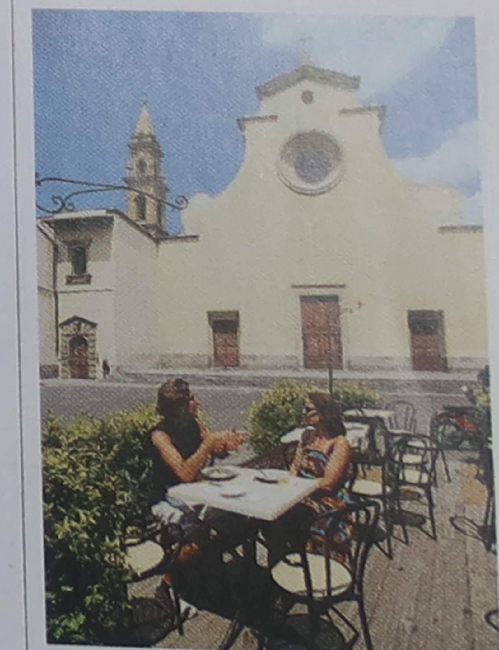
⑬ Terrasse d'un café sur la piazza di Santo Spirito

Passez le pont Amerigo Vespucci jusqu'au joli quartier baptisé borgo San Frediano. Ses rues étroites regorgent de magasins d'artisans et de maisons typiques. À droite s'élève la porta San Frediano ⑩, édifée en 1324, dont les portes en bois massives et les vestiges du rempart attenant sont très bien conservés. Revenez sur vos pas en reprenant le borgo San Frediano, puis tournez à gauche pour emprunter la via Cestello