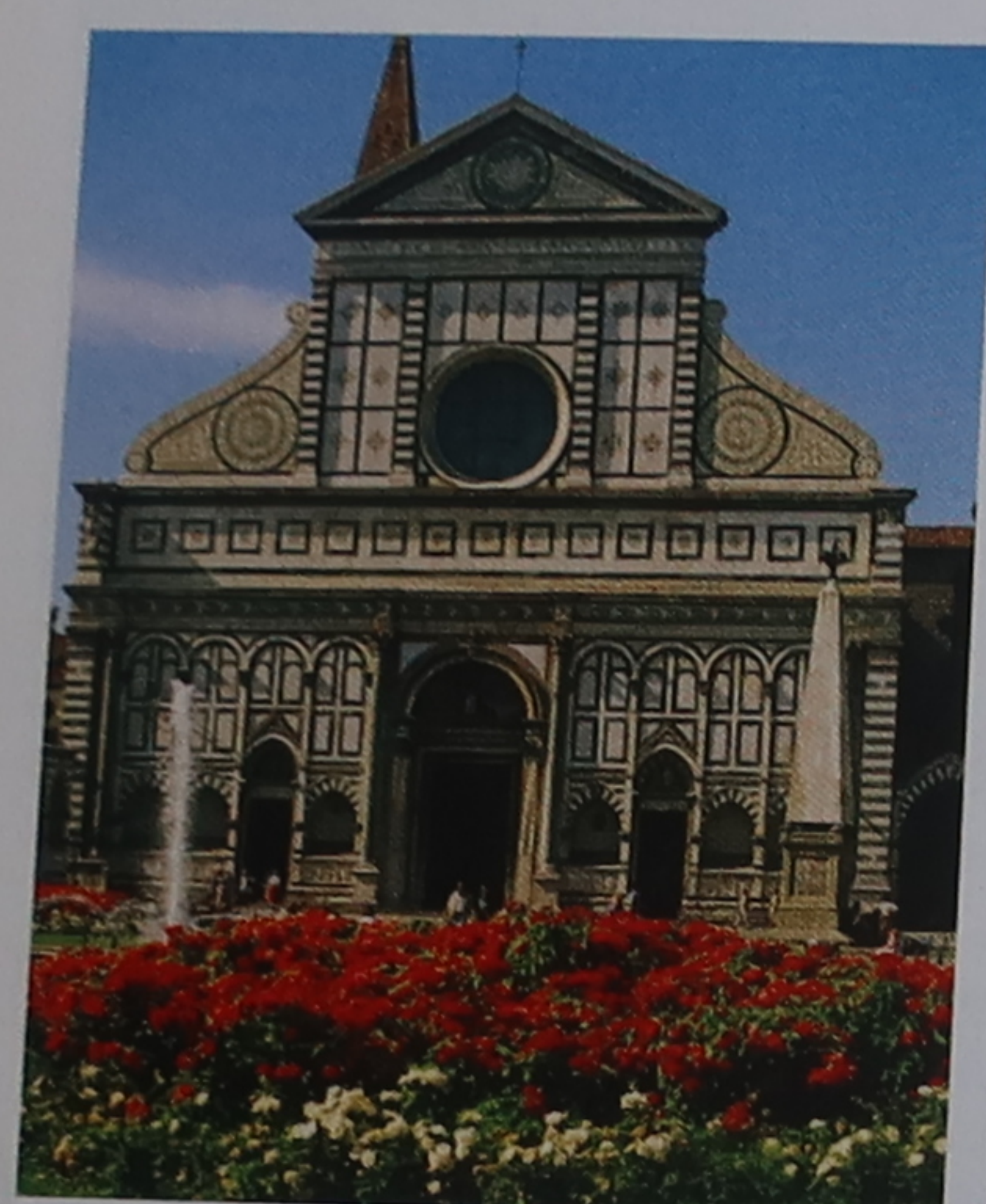
③ Vue de la piazza di Santa Maria Novella jusqu'à l'église paroissiale

Cette balade démarre sous l'horloge de la stazione di Santa Maria Novella, un imposant édifice moderne, et vous mène à l'une des plus grandes églises de Florence, en passant par les magasins à la mode et les palais médiévaux de la piazza Santa Trinità. Vous traverserez l'Arno jusqu'aux limites ouest de l'Oltrarno, où se trouvent quantité de boutiques d'artisans, puis vous découvrirez la piazza del Carmine pour finir sur la piazza di Santo Spirito, cœur du quartier bohème de la ville.