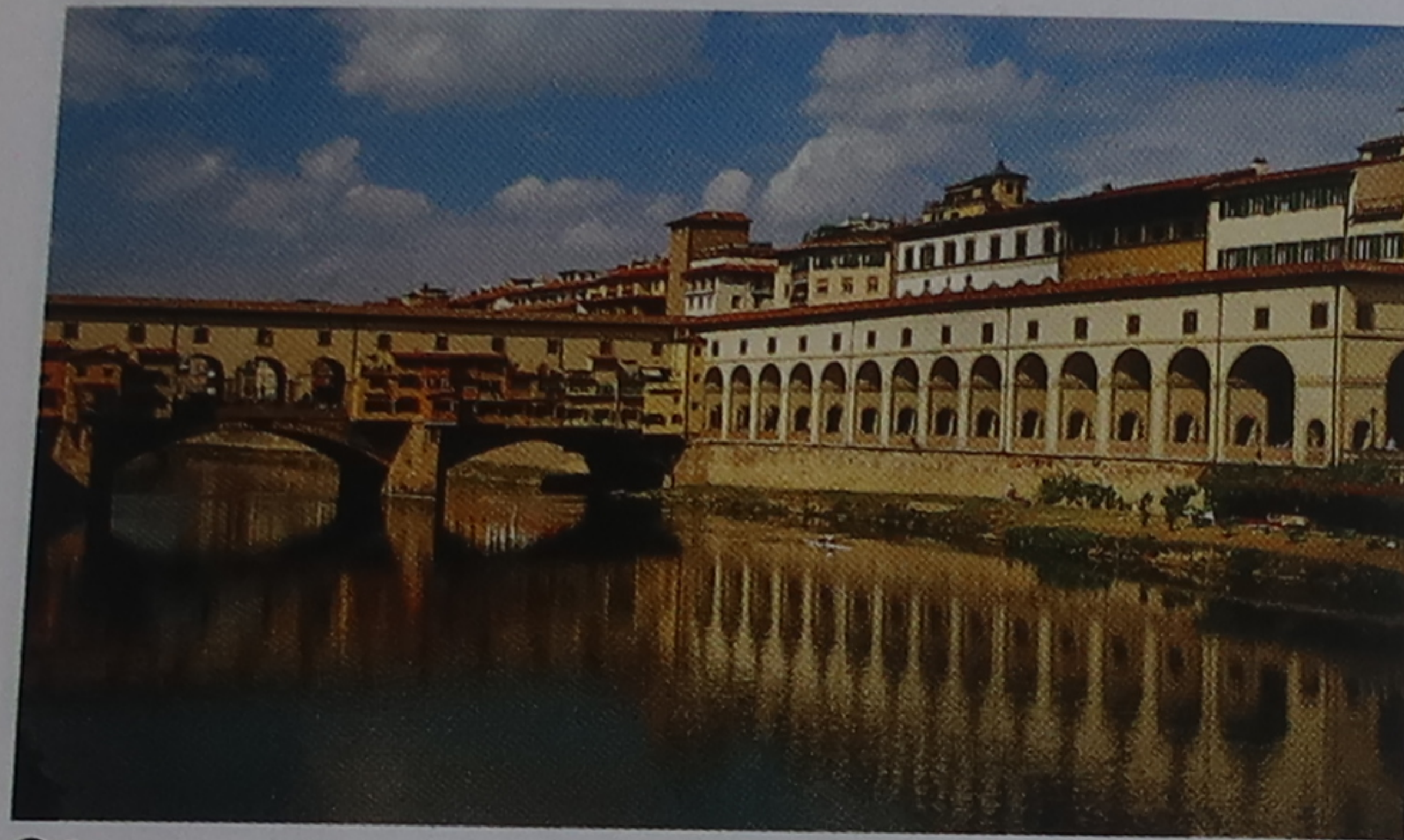
① Panorama sur le Ponte Vecchio et le corridoio Vasariano

Ce parcours vous fera découvrir les grands monuments Renaissance de Florence. Mieux vaut l'effectuer en début de séjour pour s'imprégner de l'ambiance historique de la ville. En haut du campanile de Giotto, admirez la vue d'ensemble sur les ruelles de la cité, ses toits typiques et ses belles tours.