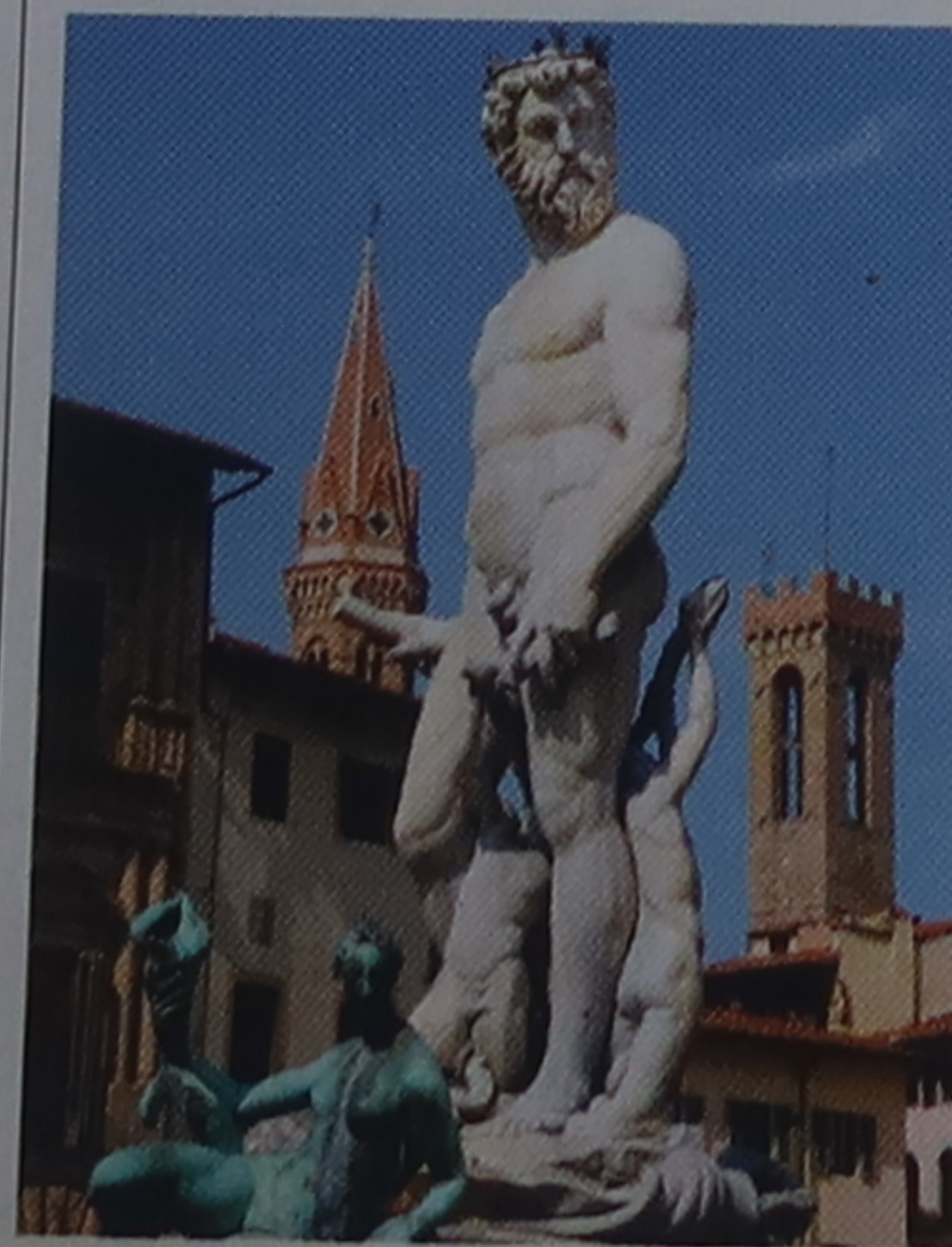
④ Piazza della Signoria et sa fontaine

Au nord de la place, à gauche, s'élève la Badia Fiorentina ⑥, l'une des plus anciennes églises de la ville, coiffée d'une très grande tour. En face, l'ancienne