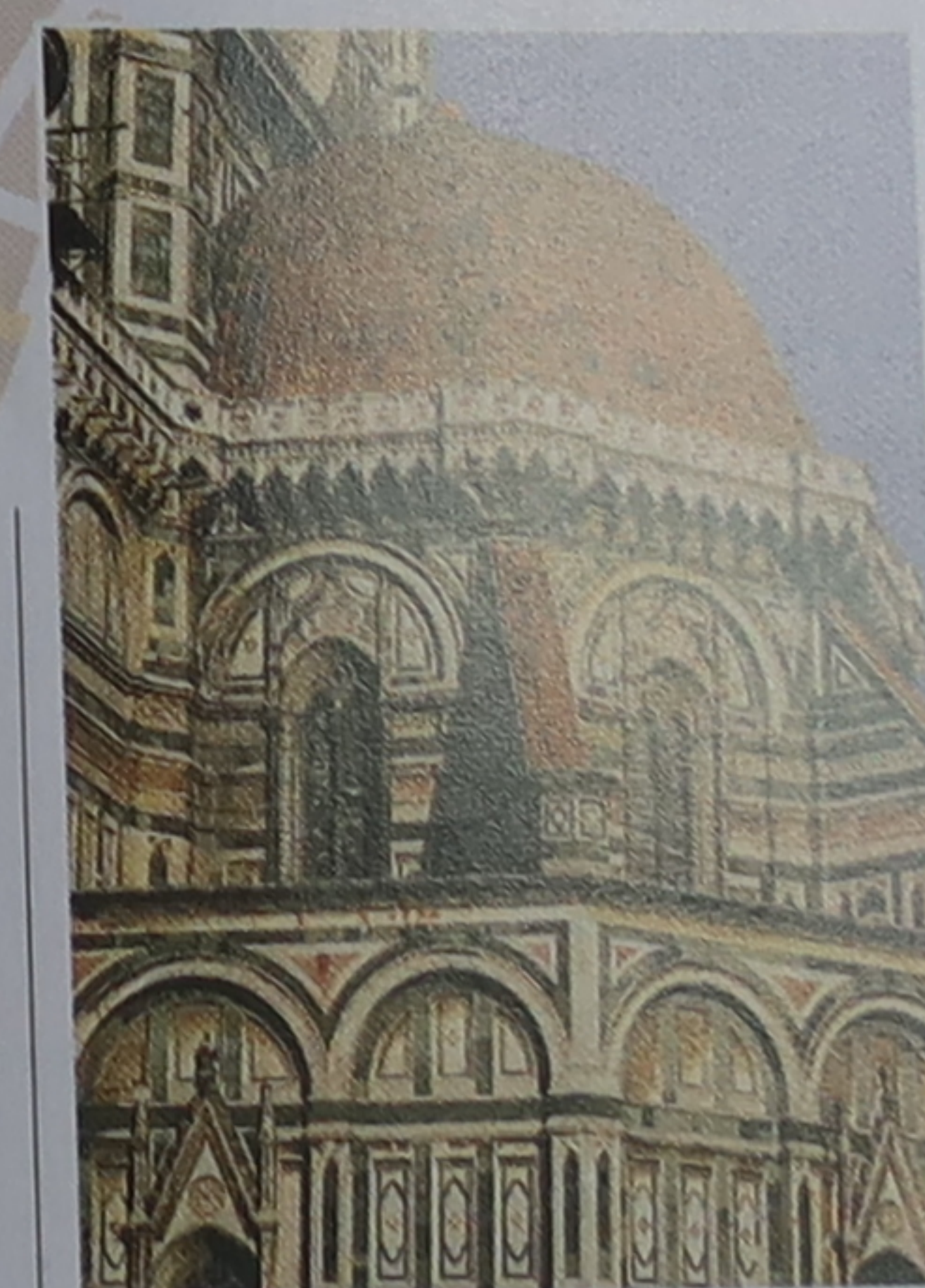
⑧ Le Duomo de Florence et sa façade au revêtement en marbre caractéristique