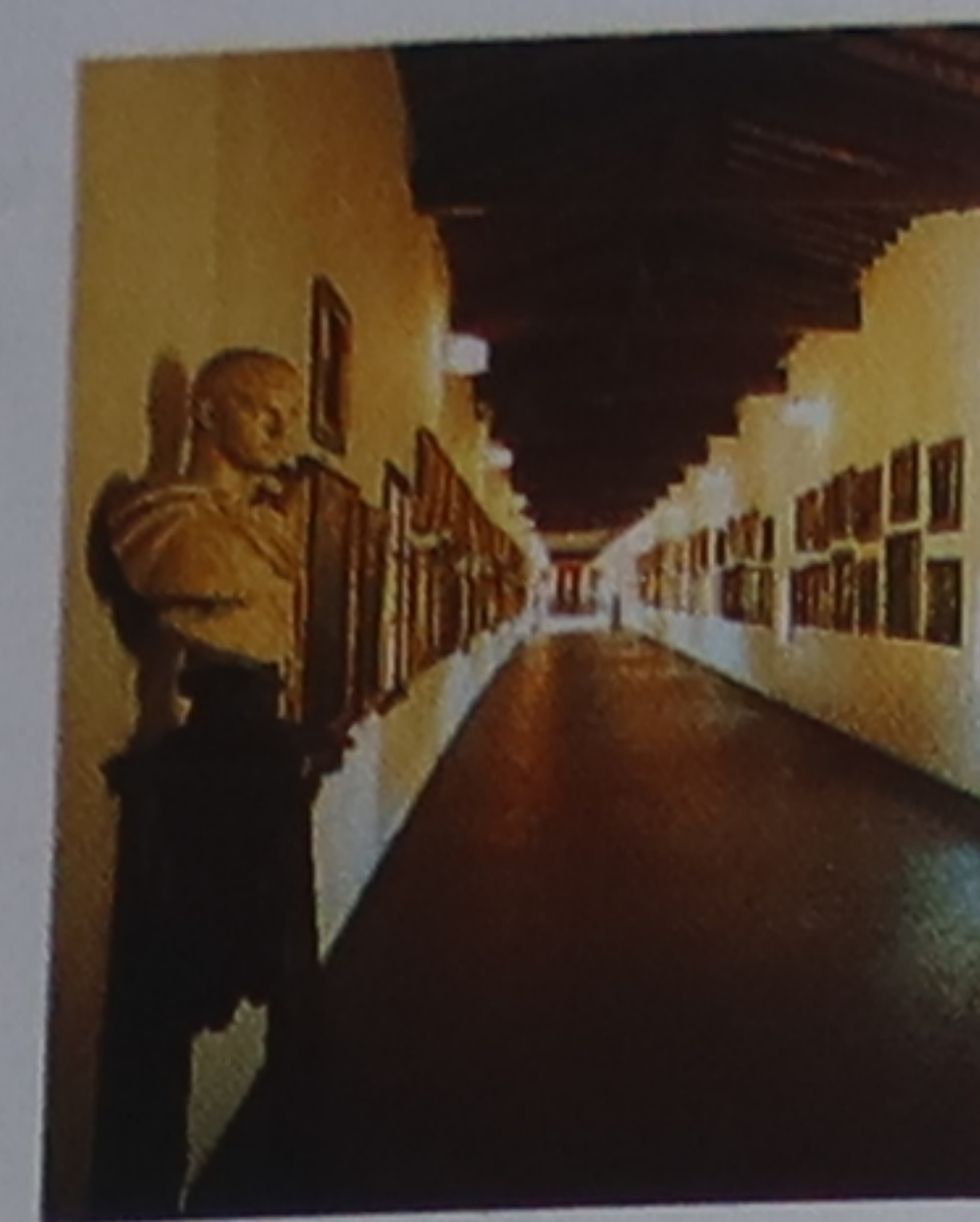
Corridoio Vasariano Le corridor de Vasari, longue galerie bâtie au-dessus du Ponte Vecchio, renferme les autoportraits de grands artistes comme Rembrandt, Rubens et Hogarth.