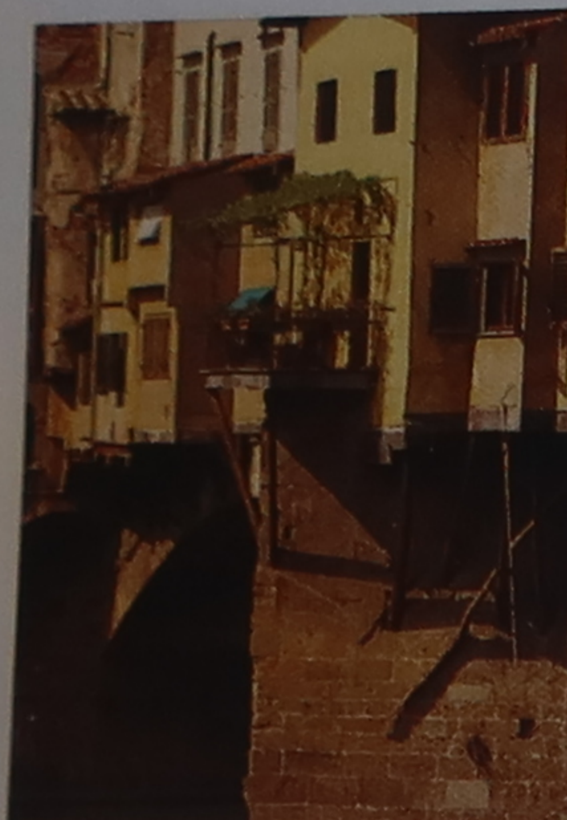
Ateliers en surplomb Certains des plus anciens ateliers débordent au-dessus du fleuve sur des consoles de bois, appelées sporti .

Édifié en 1345, le Vieux Pont est sans conteste le plus ancien pont de Florence ; durant la Seconde Guerre mondiale, les nazis dynamitèrent tous les autres pour protéger leur retraite. Depuis son origine, il abrite quantité d'échoppes. Toutefois, les bouchers, tanneurs ou forgerons du Moyen Âge, qui trouvaient l'Arno si pratique pour se débarrasser de leurs déchets, furent chassés en 1593 par Ferdinand 1 er , indisposé par le bruit et les odeurs pestilentielles. Il les remplaça par des joailliers et des orfèvres. La tradition s'est maintenue jusqu'à nos jours, et les boutiques du pont proposent aux visiteurs bijoux modernes et anciens.