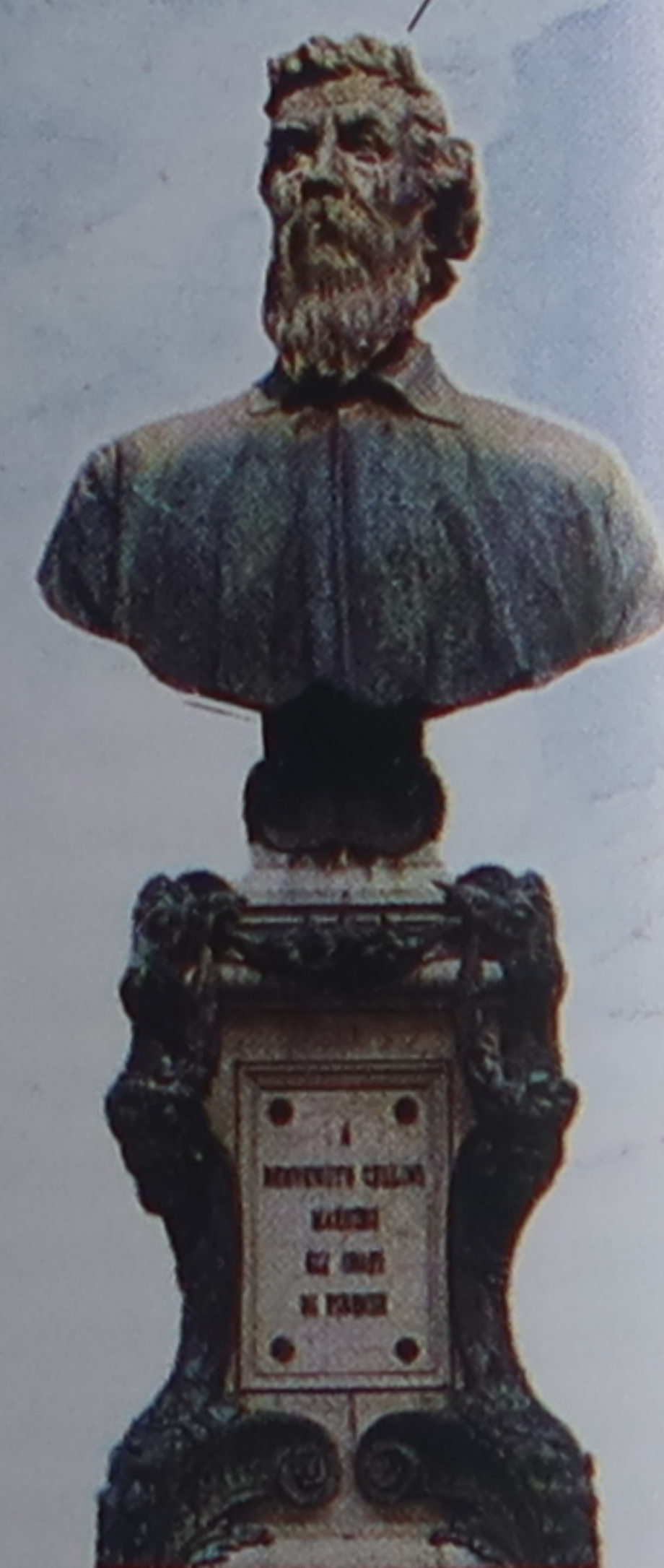
Buste de Cellini Un buste de Benvenuto Cellini (1500-1571), le plus célèbre des orfèvres florentins, orne le Ponte Vecchio depuis 1900.