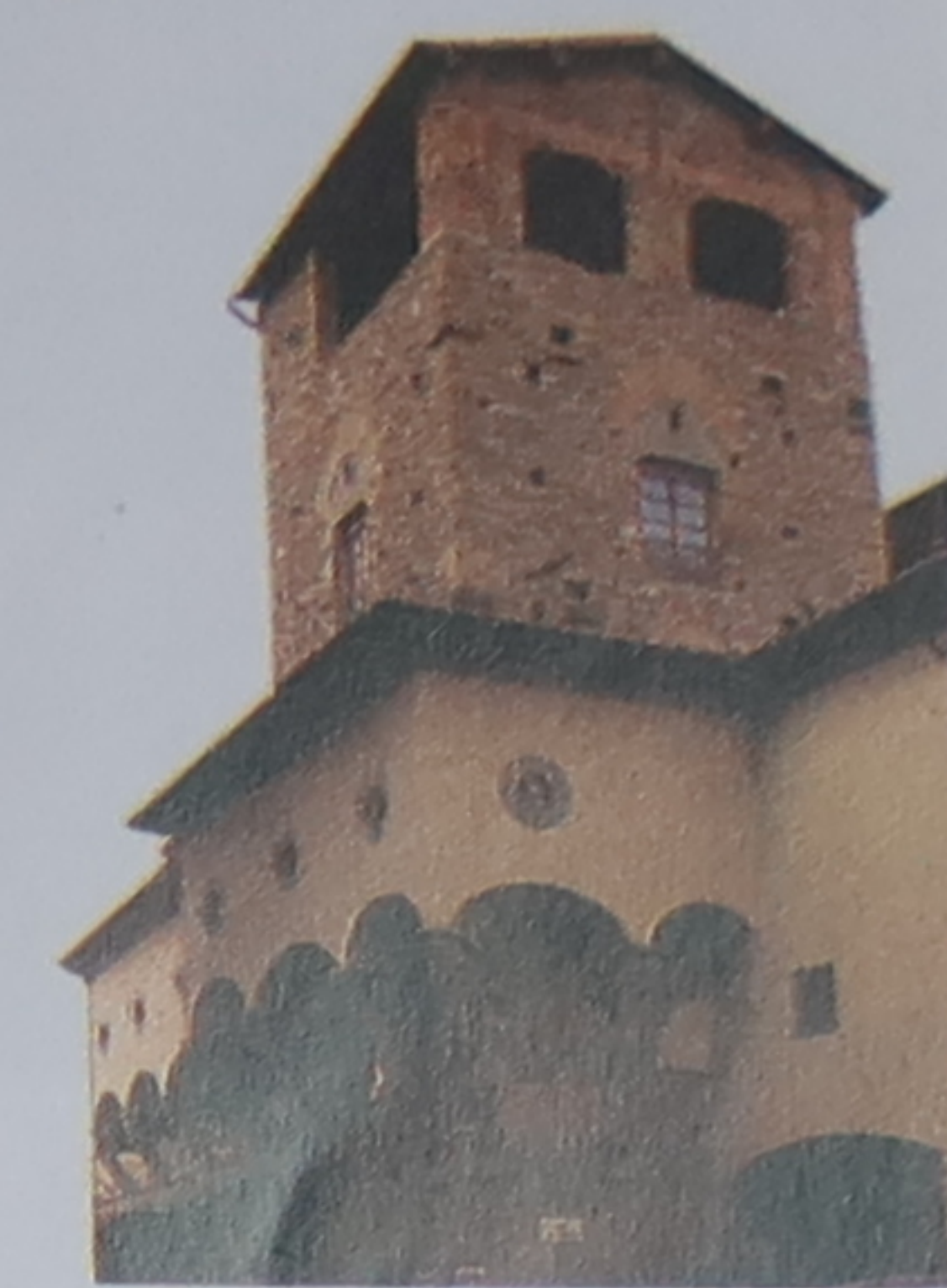
Torre dei Mannelli Les Mannelli refusèrent avec obstination de détruire cette tour médiévale qui se dressait sur le passage du corridoio Vasariano.