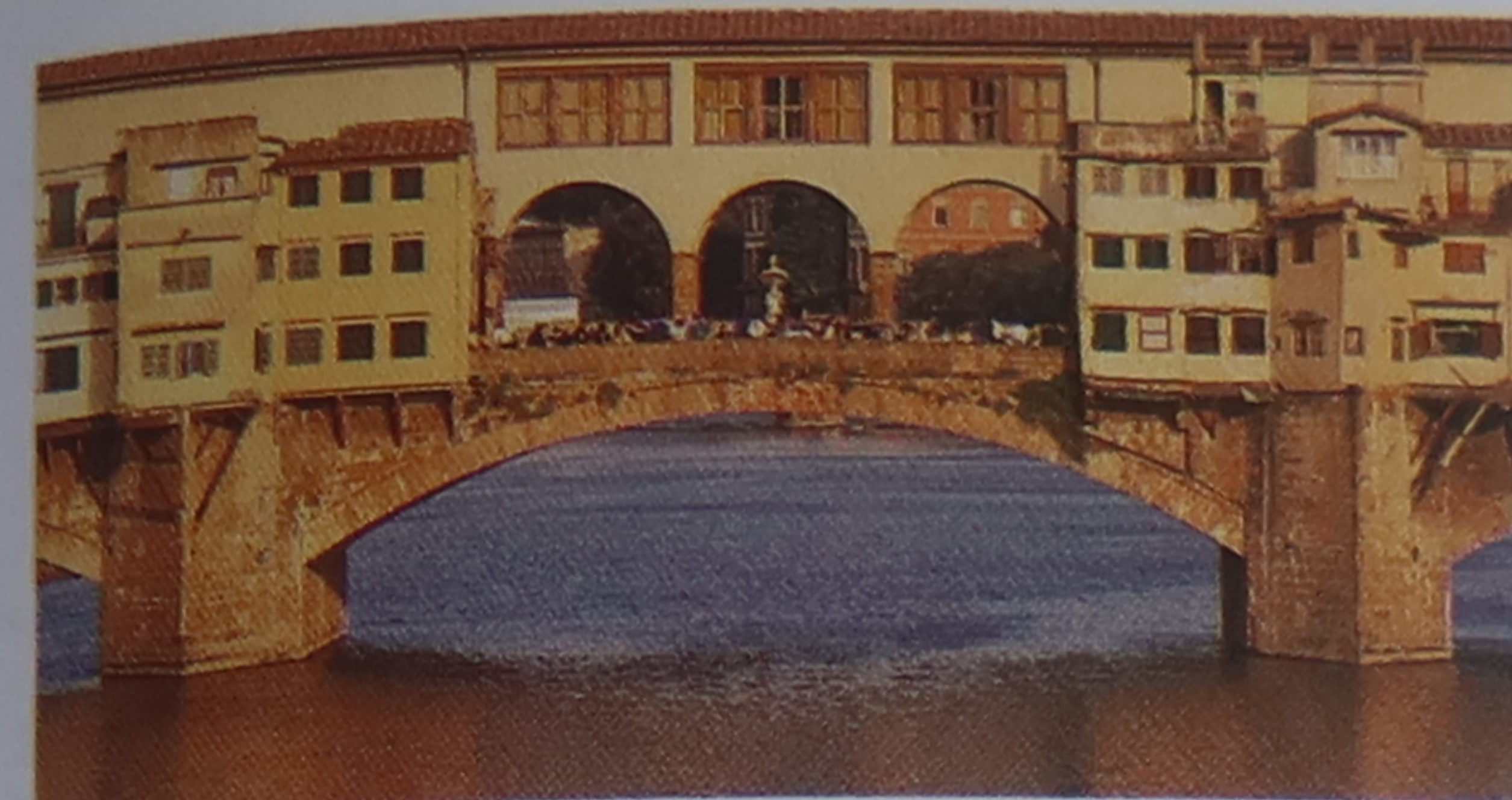
★ Ponte Vecchio au crépuscule C'est au coucher du soleil, vu depuis le pont Santa Trinità, que le Vieux Pont offre le plus beau spectacle.

Pour les hôtels et les restaurants du quartier, voir p. 253-254 et p. 266-267