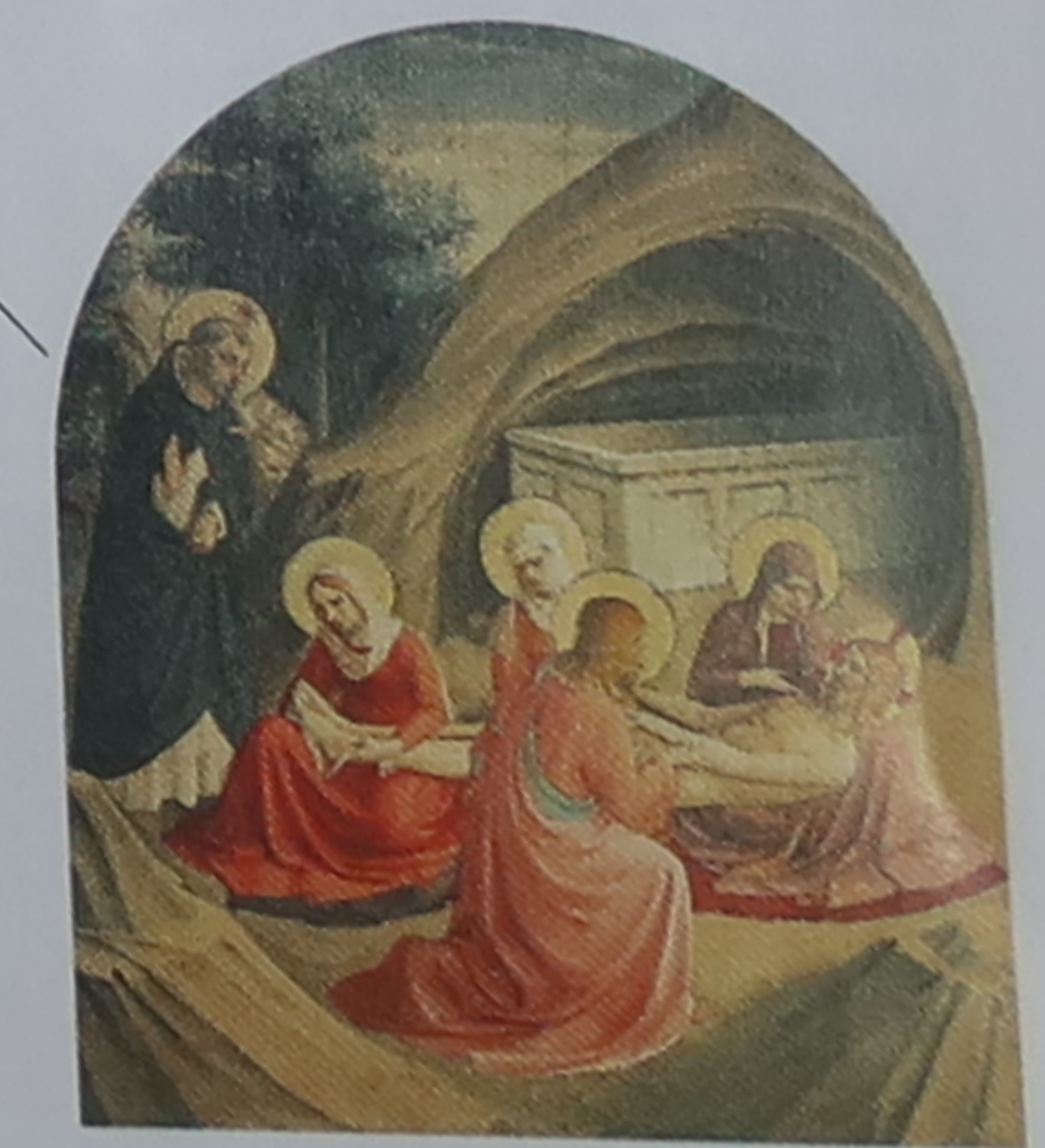
La Lamentation du Christ La cellule 2 abrite cette fresque de Fra Angelico (v. 1442) montrant saint Jean et Marie-Madeleine pleurant le Christ avant sa mise au tombeau.