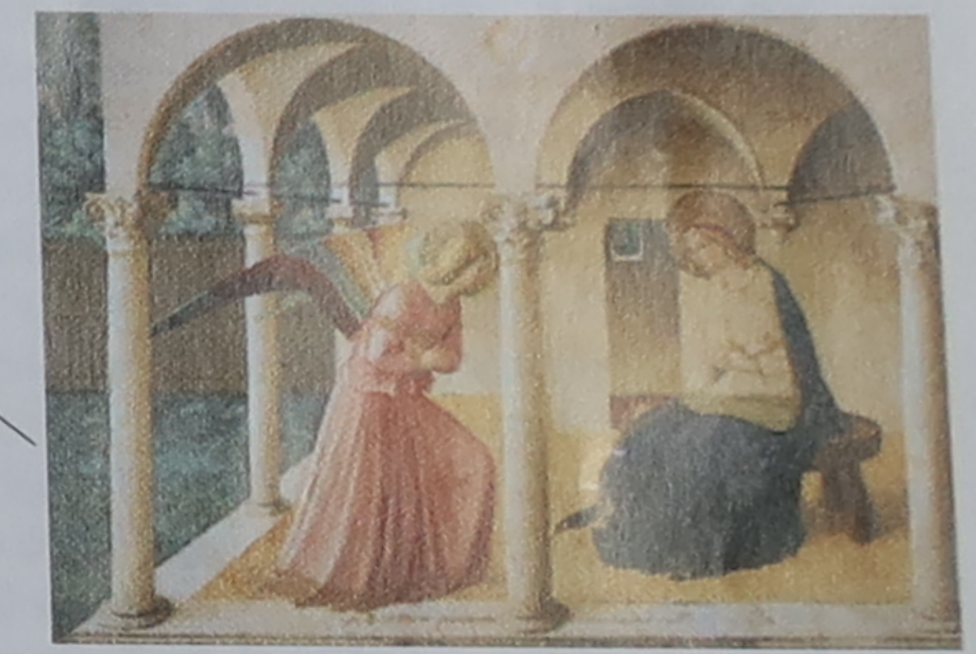
★ L'Annonciation (v. 1440) En plaçant Gabriel et la Vierge dans une loggia élaborée, Fra Angelico fait preuve de sa maîtrise des courbes en perspective.

★ Bibliothèque Michelozzo construisit pour Cosme l'Ancien la première bibliothèque publique d'Europe, en 1441.