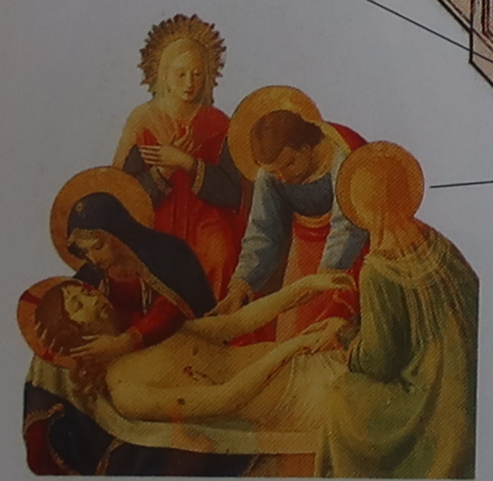
La Déposition du Christ (1435-1440) L'ancien hospice des Pèlerins renferme nombre de peintures de Fra Angelico et de son atelier, dont cette poignante œuvre illustrant la mort du Christ.

Entrée de l'église (chiesa di San Marco)