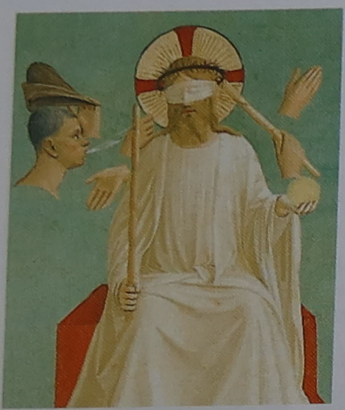
Le Christ bafoué Cette fresque allégorique de Fra Angelico (v. 1440) ne montre que des symboles des outrages subis par le Christ.

Désirant y accueillir les moines dominicains de Fiesole, Cosme l'Ancien confia en 1437 à Michelozzo (son architecte préféré) l'agrandissement du couvent de Saint-Marc fondé au XIII e siècle. À la demande de saint Antonin, Fra Angelico participa à la décoration de l'édifice. Le bâtiment est d'ailleurs devenu un musée où sont réunies presque toutes les œuvres de ce peintre illuminé par la foi, surnommé « le peintre des anges ».