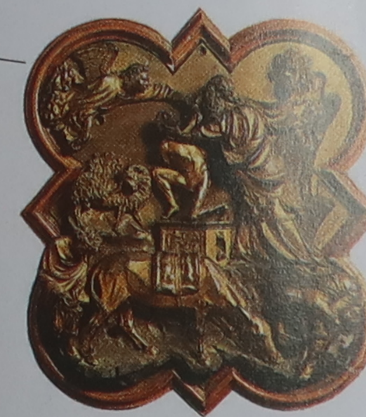
★ Panneaux du concours des portes du baptistère Le panneau en bronze attribué à Brunelleschi (1401) représente Abraham sur le point de sacrifier Isaac (p. 70).