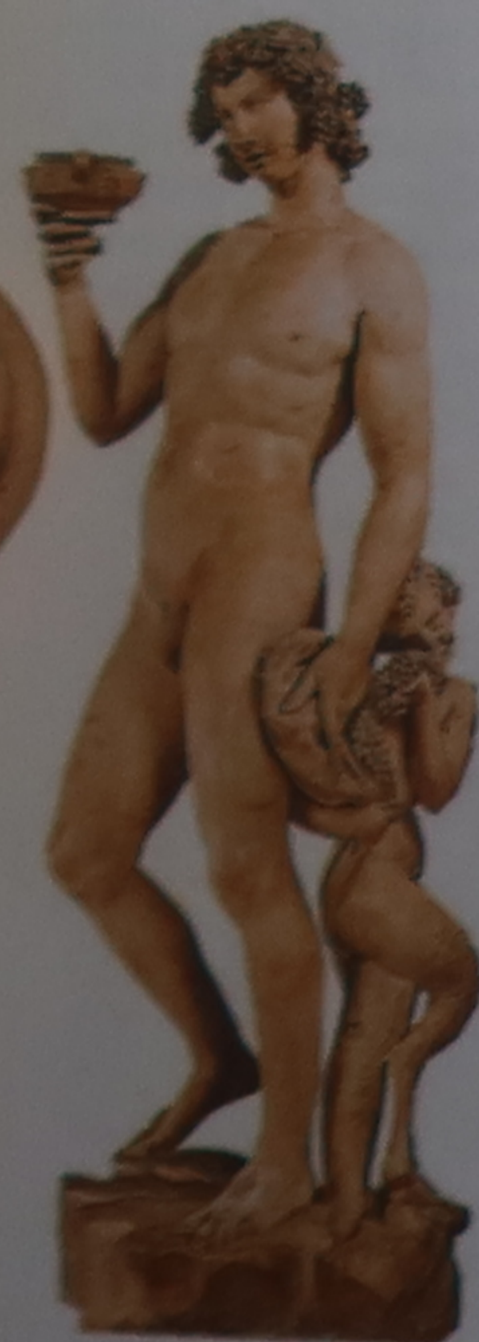
★ Bacchus de Michel-Ange Il s'agit de la première sculpture importante de l'artiste, conçue en 1497. À l'opposé des œuvres idéalisées de l'Antiquité, le dieu du Vin est ici montré en pleine ivresse.

À droite de l'entrée s'ouvre la salle contenant les statues de Michel-Ange – dont celle de Bacchus (1497). L'escalier de la cour mène à la loggia, avec les oiseaux sculptés par Jean de Bologne, depuis laquelle on passe dans la salle Donatello. Celle-ci abrite les panneaux du concours des portes du baptistère. La chapelle de la Madeleine et l'art islamique se trouvent également à ce niveau. Les salles Verrocchio et Andrea et Giovanni della Robbia, celle des petits bronzes et la collection d'armes sont au 2 e étage.