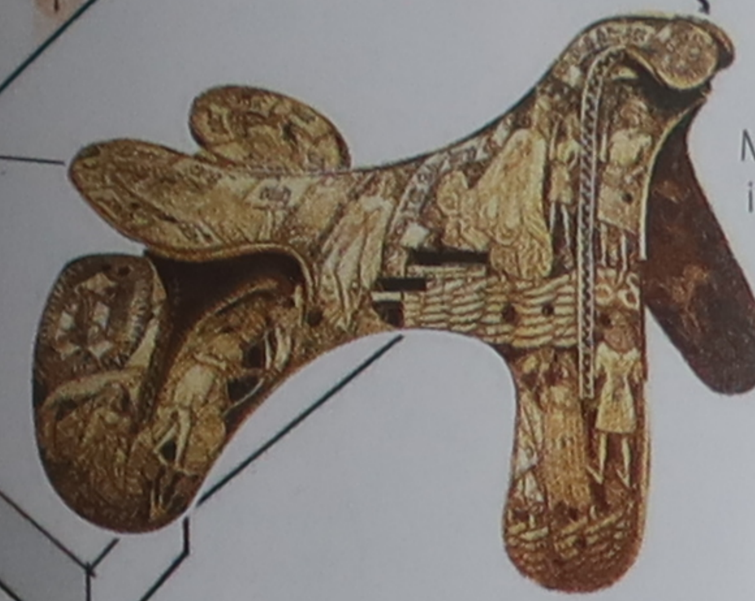
Selle marquetée Commande des Médicis, cette selle incrustée d'ivoire servait durant les joutes au X e siècle.