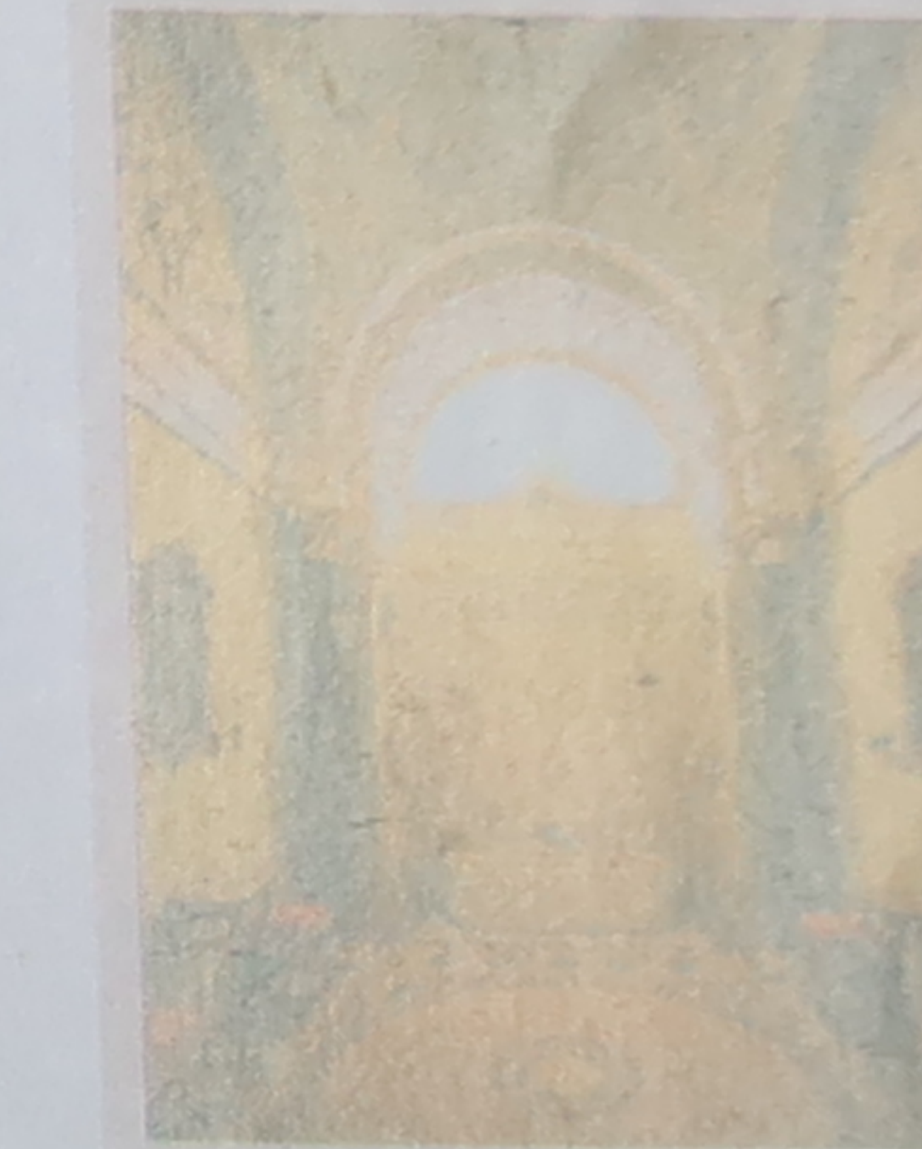
Salle de bains de Napoléon L'Empereur n'utilisa jamais cette salle de bains créée spécialement pour lui au palazzo Pitti (p. 126).