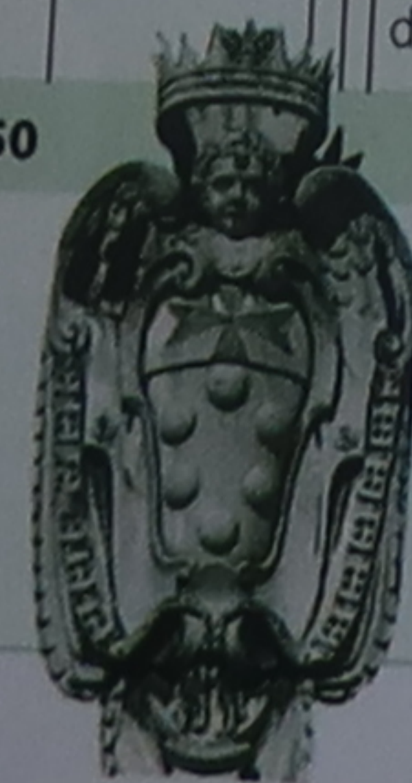
Emblème des Médicis