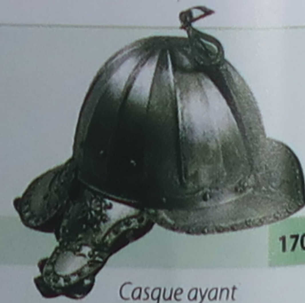
Casque ayant appartenu à Cosme III

Au XVII e siècle, les Médicis accordèrent leur protection à de nombreux savants. Parmi eux figure Galilée (1564-1642), dont les expériences et les observations astronomiques posèrent les grands fondements de la démarche empirique moderne. Ses fabuleuses découvertes lui valurent d'être persécuté pour avoir contredit les enseignements de l'Église catholique romaine.