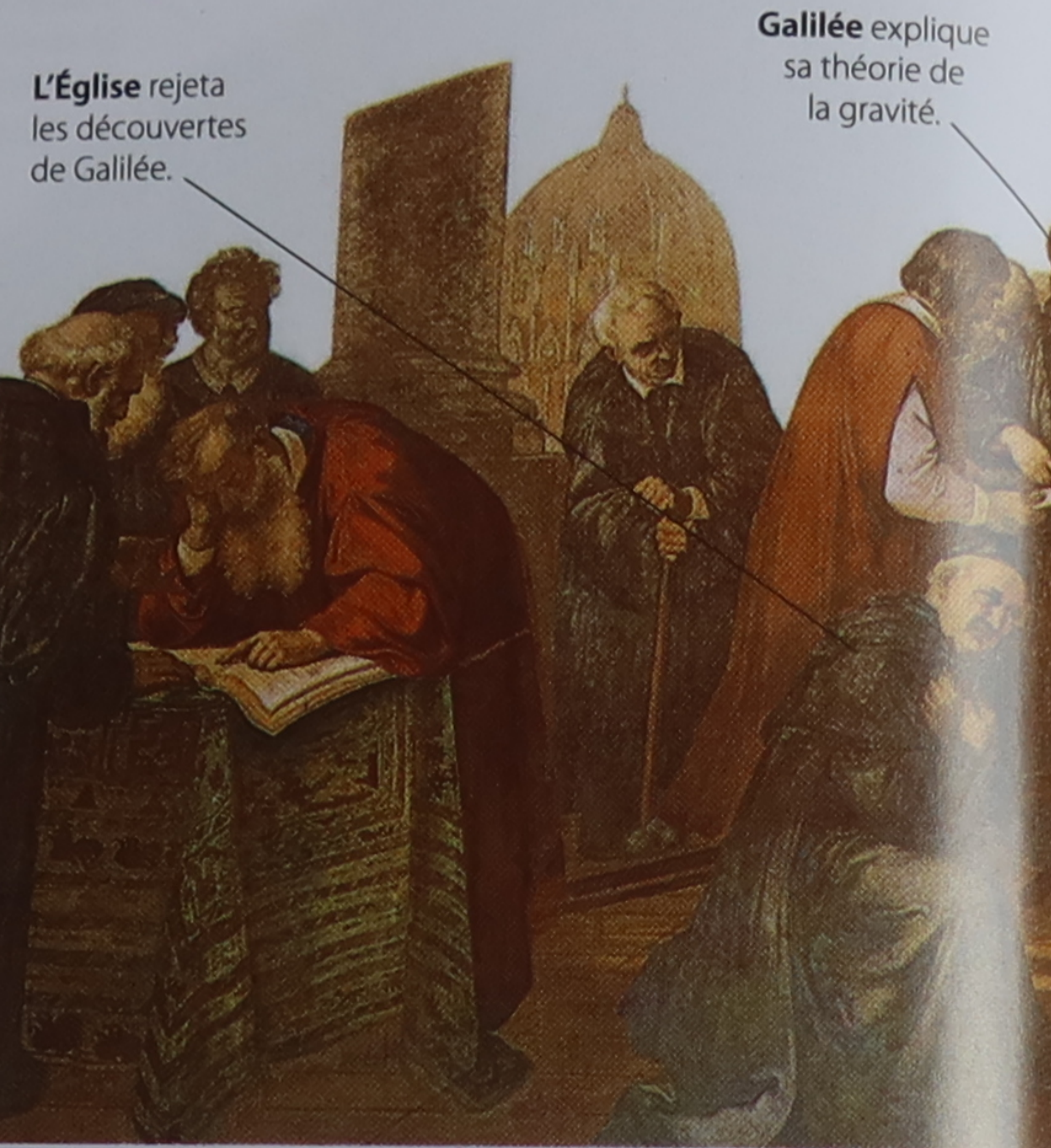
L'Église rejeta les découvertes de Galilée.