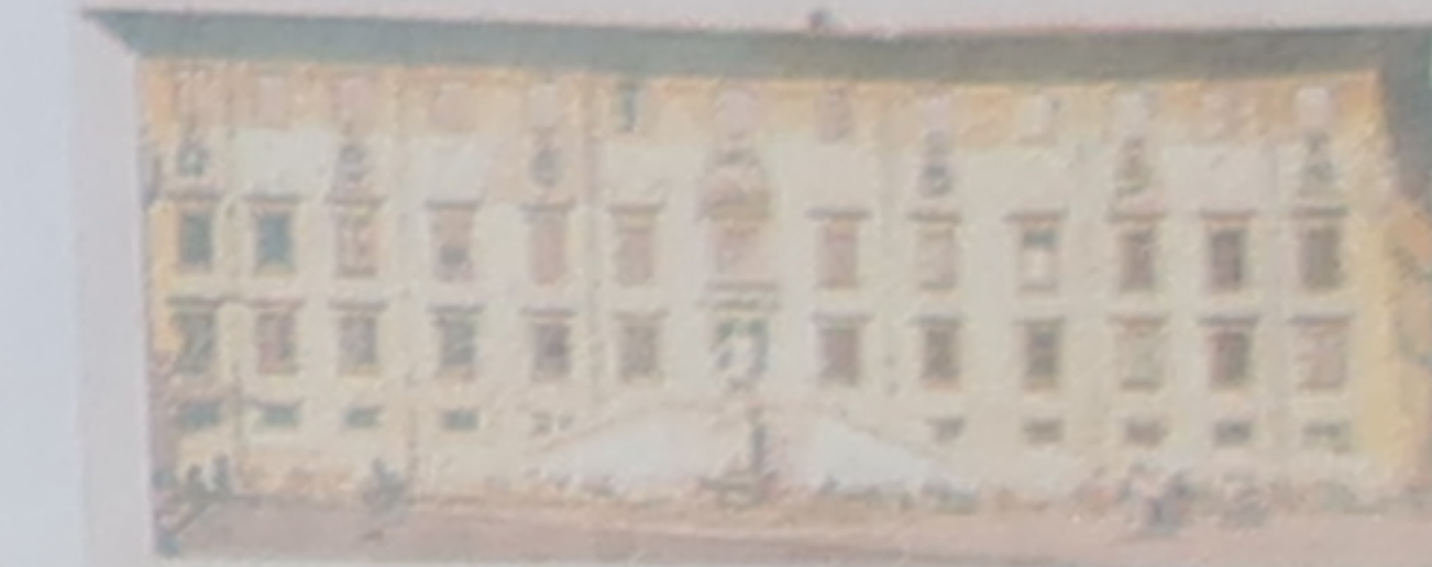
Palazzo del Cavaliere La statue de Cosme I er (1596), due à Francavilla, se dresse devant le palais des Chevaliers conçu par Vasari (p. 160-161).

Les Médicis réunirent pendant cette période les collections des Offices (p. 84-87), ainsi que celles du palazzo Pitti (p. 124-127), le bâtiment d'où les grands-ducs gouvernèrent la Toscane durant plus de trois siècles. La captivante histoire de Galilée et de ses contemporains est présentée au museo Galileo (p. 78) de Florence, tandis que les superbes fresques de la sala del Risorgimento, dans le Palazzo pubblico (p. 222-223) de Sienne, décrivent les événements qui précéderent l'unification du pays.