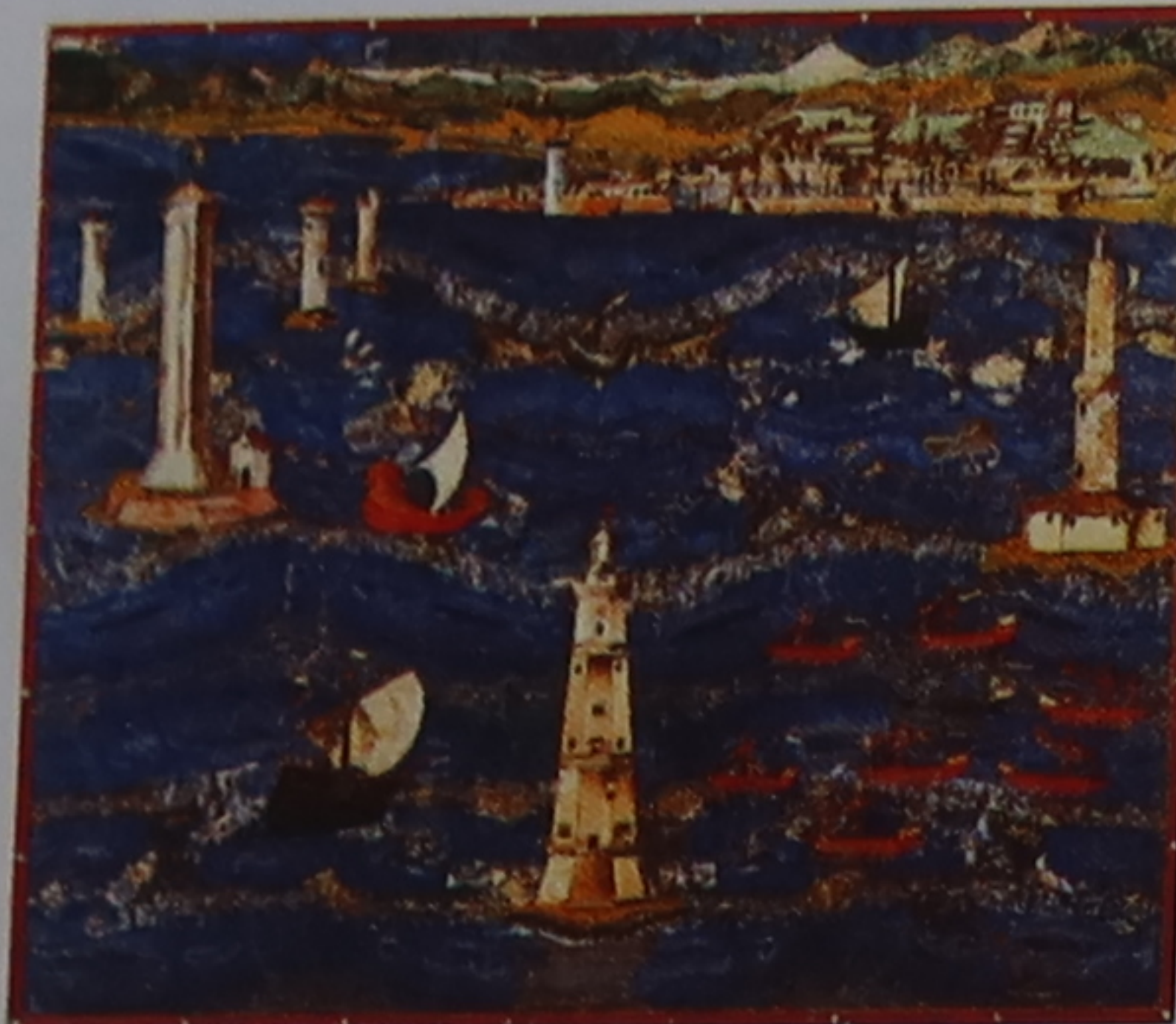
Port de Livourne Livourne (Livorno) devint un port franc en 1608 : les navires de tous les pays y jouissaient des mêmes droits d'accostage. Des réfugiés juifs et maures affluèrent, contribuant à la prospérité de la cité.

Après avoir imposé l'unité politique en Toscane, Cosme I er de Médicis en devient le grand-duc en 1570. Commence alors une longue période de prospérité pendant laquelle les Médicis s'emploient à fonder un État toscan à partir de cités rivales. La dynastie s'éteint en 1737 et le grand-duché passe aux mains des ducs autrichiens de Lorraine. Le Risorgimento, mouvement patriotique italien, les chassera du pouvoir en 1860. Florence sera en 1865 la capitale de la jeune nation italienne, et ce jusqu'en 1871, un an après l'unification consécutive à la prise de Rome.