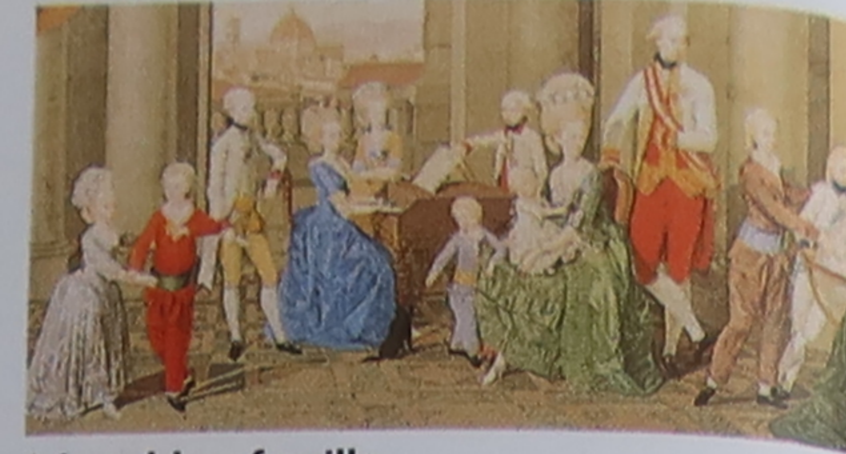
Léopold en famille Entre autres réformes, Léopold I er , le futur empereur d'Autriche Léopold II, abolit la peine de mort.