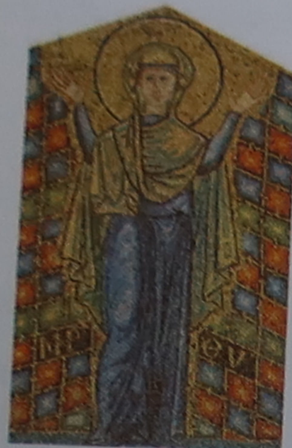
Mosaïque de la Vierge Cette mosaïque issue de la ville de Cortona (p. 208) témoigne de l'influence byzantine sur l'art du début du Moyen Âge.

Assaillie par des tribus germaniques, telles que les Goths et les Lombards, l'Italie connut de sombres années du vi au viii siècle. En 774, Charlemagne, alors roi des Francs, répond à l'appel du pape et chasse les Lombards de Toscane. En récompense, il est sacré empereur d'Occident par Léon III, ouvrant sans le savoir la voie aux interminables conflits qui opposeront la papauté au Saint Empire.