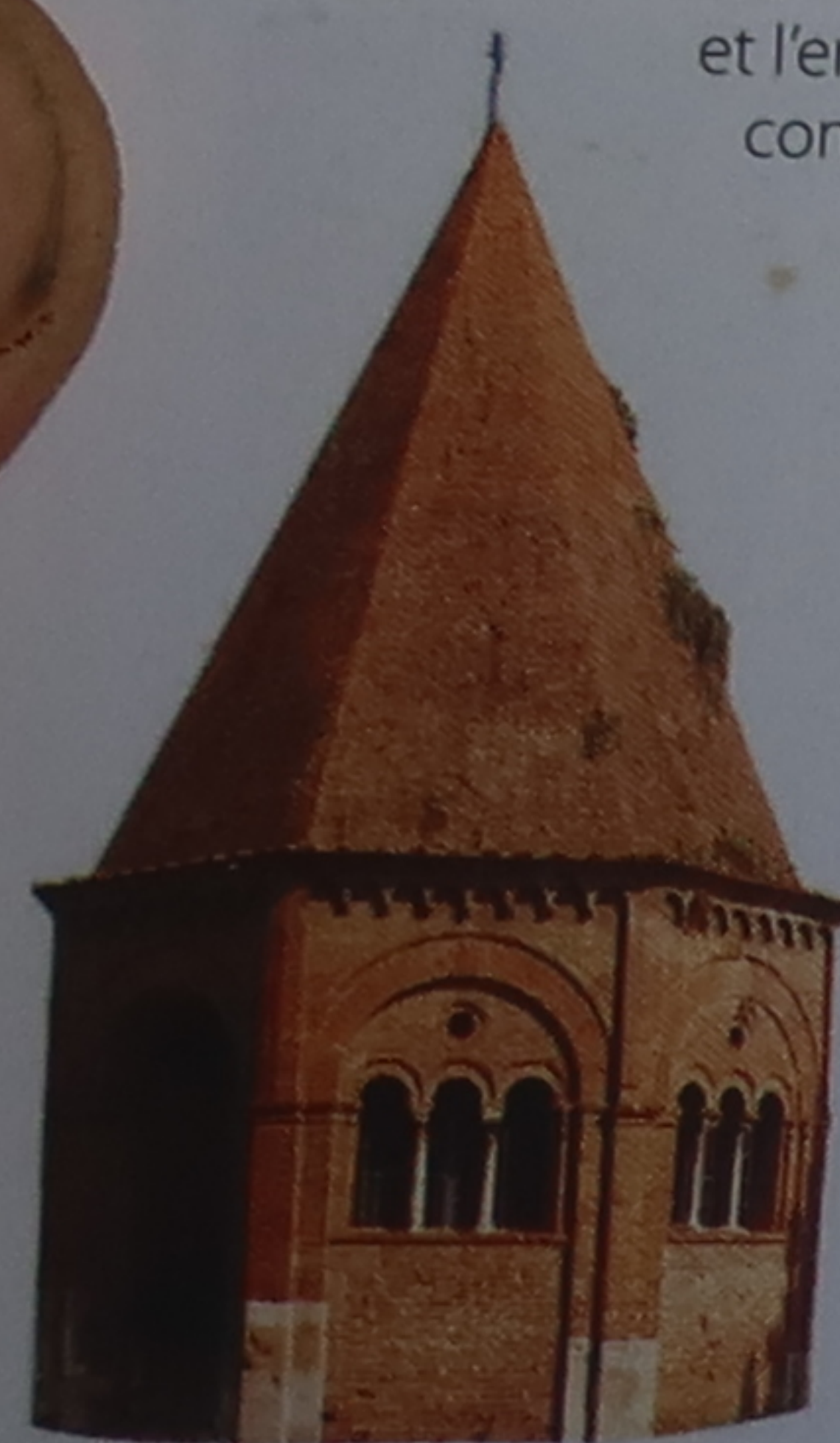
Chapelle de Sant'Agata Nombre de sanctuaires chrétiens les plus anciens de Toscane, comme cette chapelle pisane du xiii siècle (p. 165), furent élevés sur la tombe d'un saint martyrisé par les Romains.