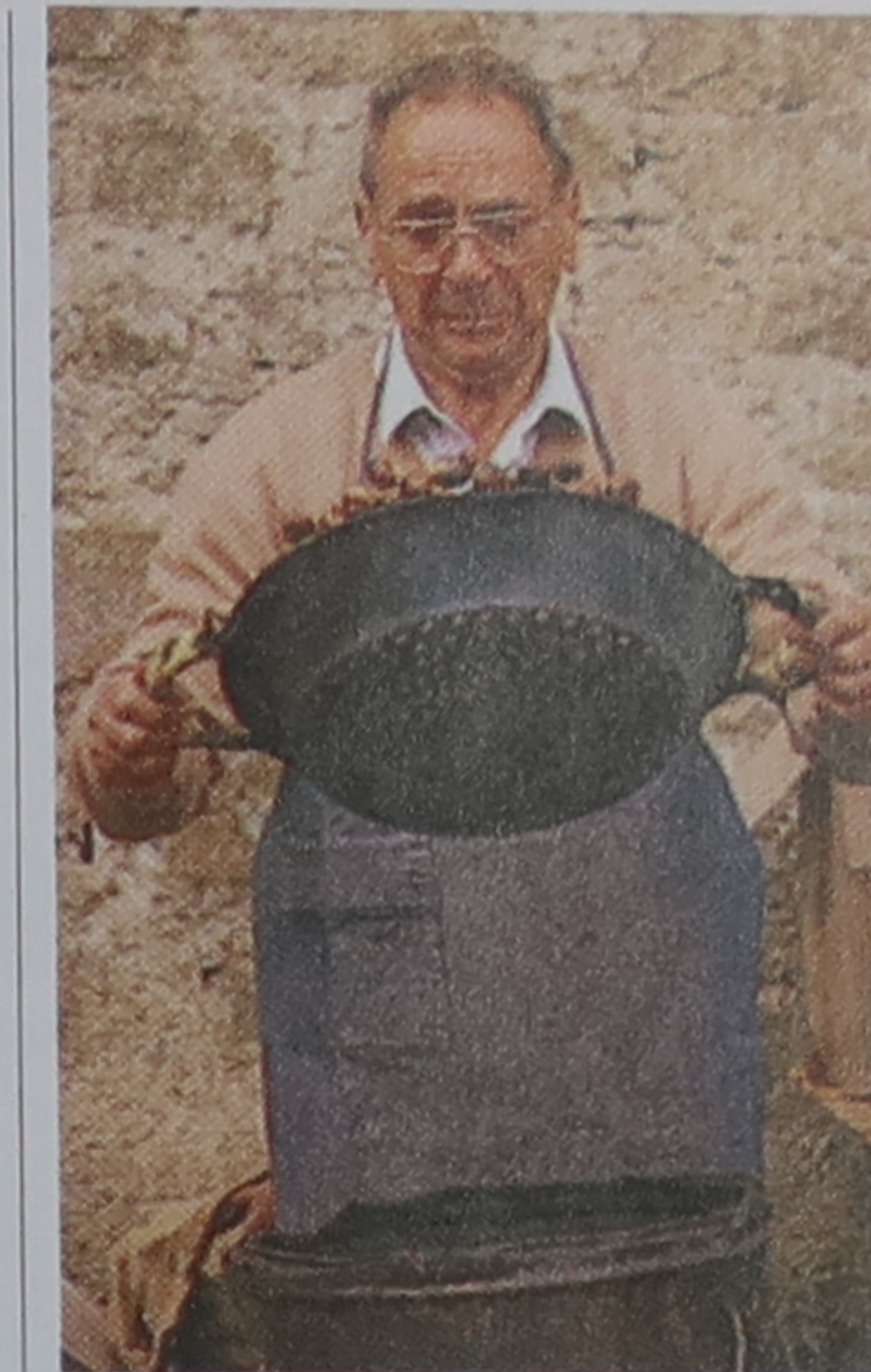
Marrons grillés, Montalcino

Pitti Immagine Uomo , (courant janv.), fortezza da Basso,