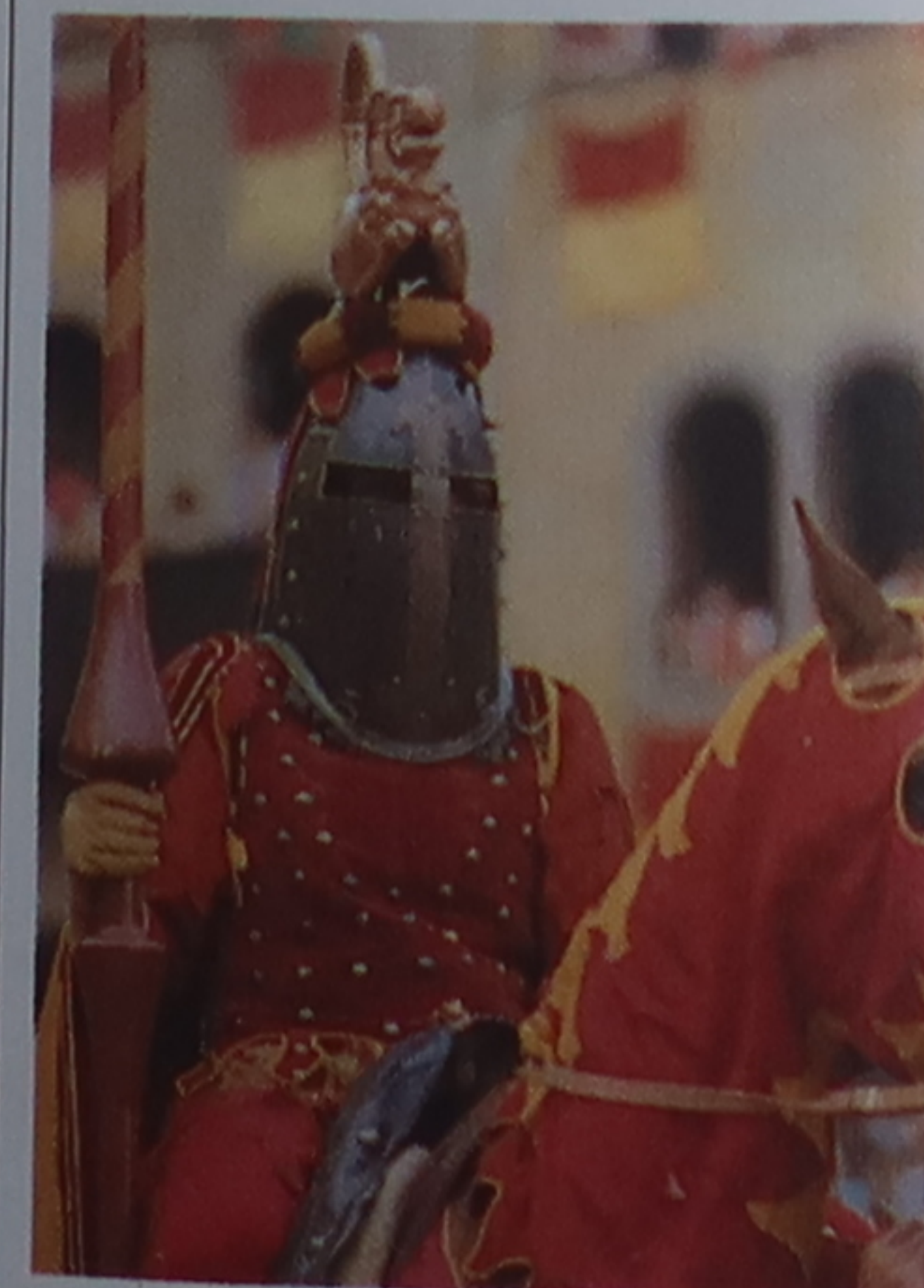
Participant à la Joute du Sarasin d'Arezzo

Sagra del Tordo , ou fête de la Grive (dern. dim.), Montalcino (p. 43).