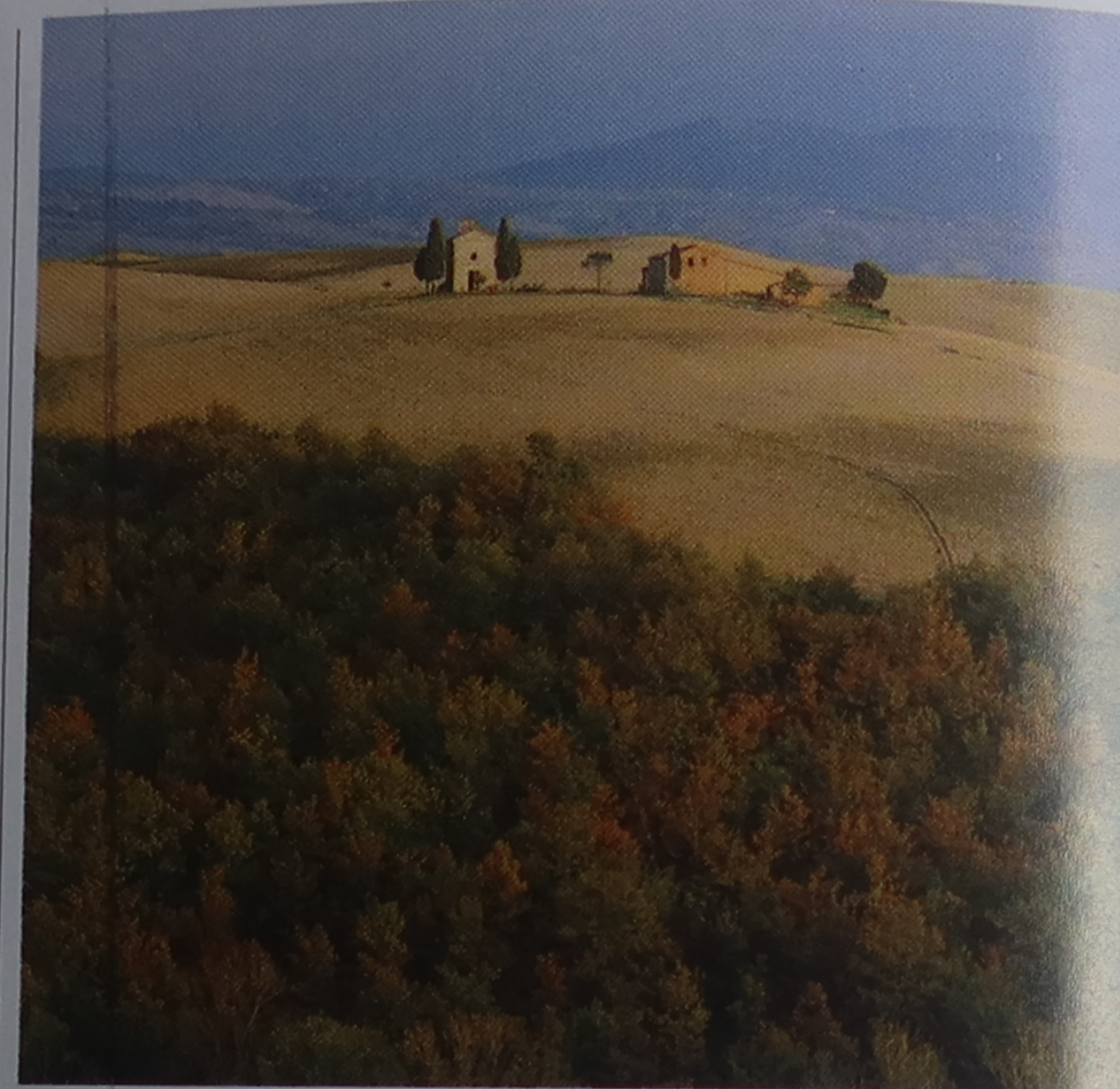
Automnè dans le Val d'Orcia, sud de la Toscane

(7 sept.), piazza della Santissima Annunziata, Florence. Brandissant de petites lanternes de papier coloré, les enfants