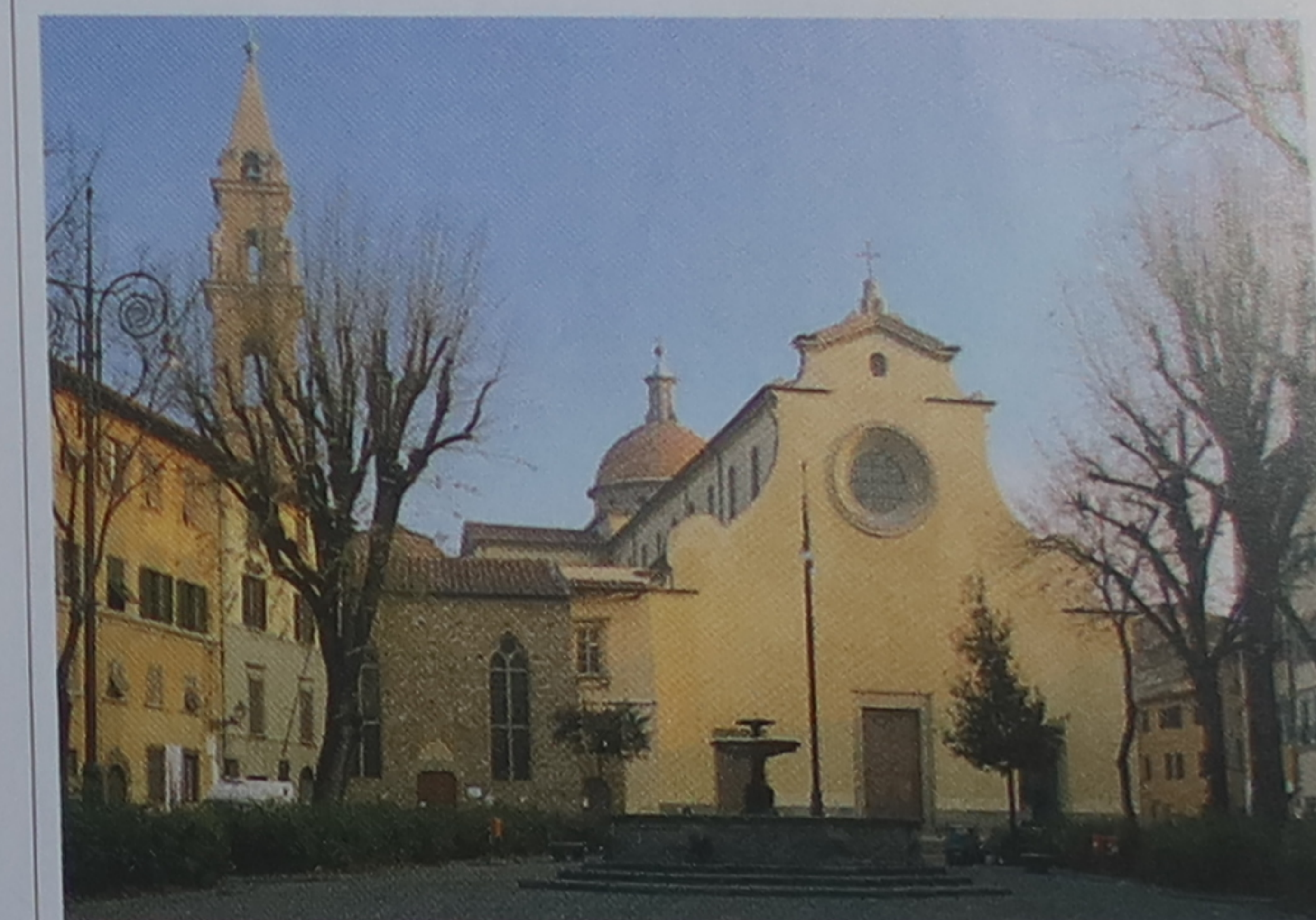
Pas de foule en hiver sur la piazza di Santo Spirito, Florence