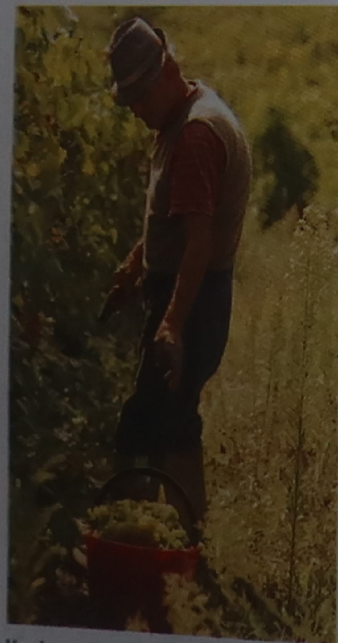
Vendanges dans le Chianti

C'est la saison des vendanges, la vendemmia . Le vin a d'ailleurs sa grande fête dans le Chianti. Ne manquez pas les nombreux sagre (festivals), annoncés un peu partout dans la région. Ce sont des fêtes authentiques et familiales. Généralement, elles célèbrent une spécialité locale de saison, comme les champignons dont les Toscans raffolent, notamment les funghi porcini . À partir de la fin octobre, en même temps que les toutes premières gelées, les forêts se teintent d'or et d'écarlate, offrant un splendide spectacle.