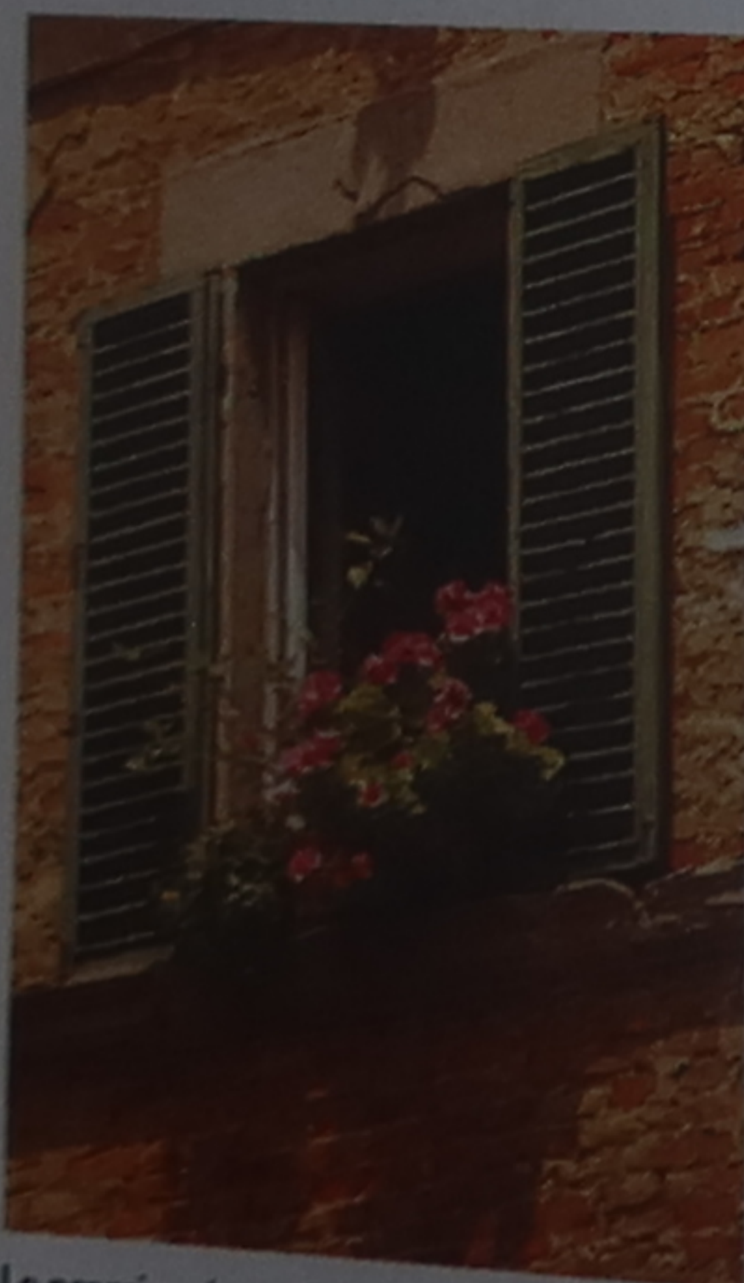
Le premier signe du printemps à Cortone : des fleurs aux fenêtres

Hormis au moment de Pâques, il y a rarement foule dans les rues de Florence et dans ses monuments, mais le temps peut se montrer imprévisible et humide.