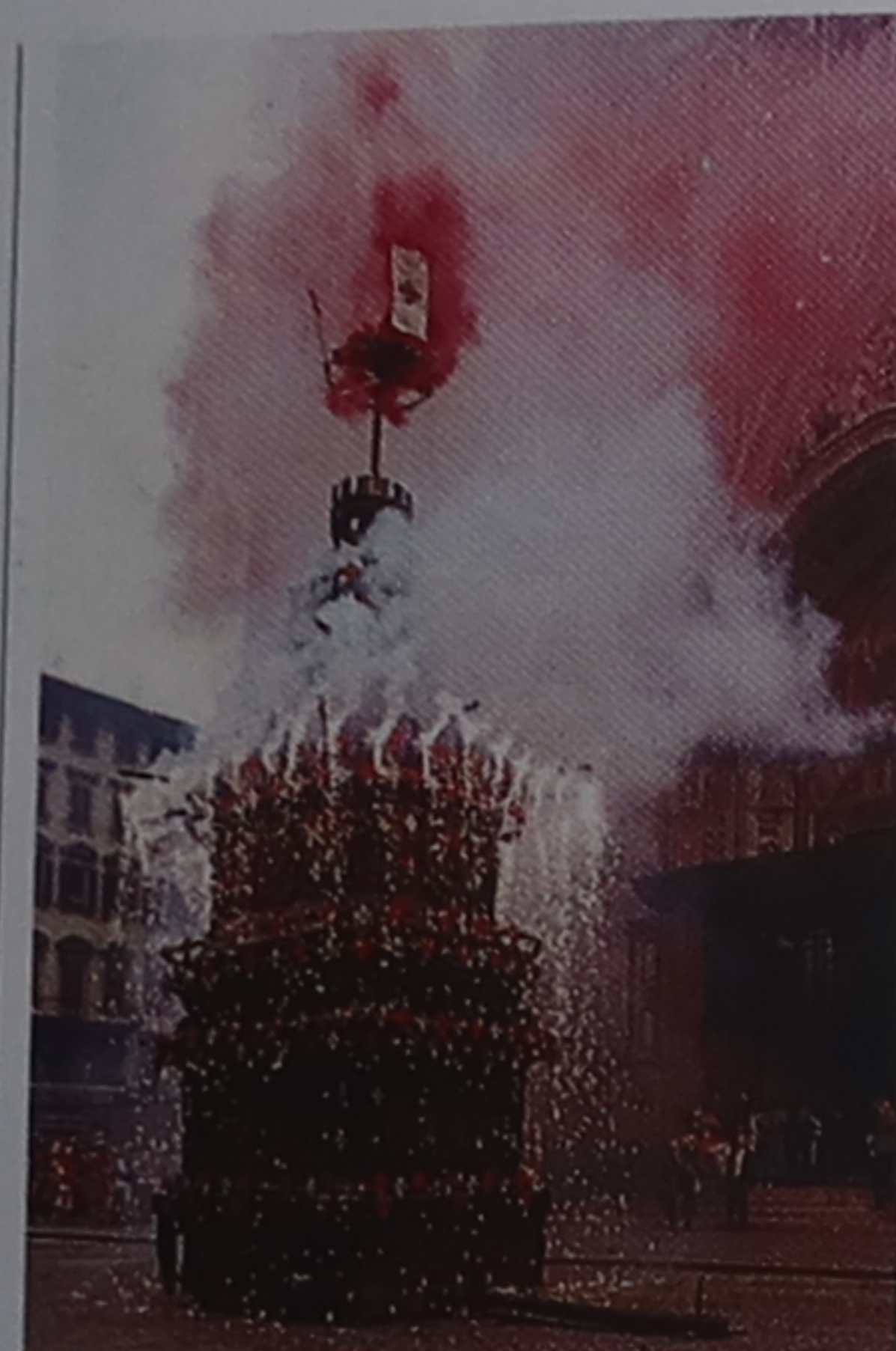
Fête de l'Explosion du char, Florence