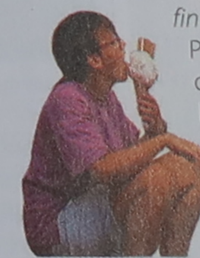
Une glace italienne, quel régal !

Festival Puccini ( fin juil.-fin août ), Torre del Lago Puccini (p. 179). Les beaux opéras de Puccini sont à l'honneur dans un théâtre de verdure près du lac au bord duquel vécut le compositeur. Rodeo della Rosa ( 15 août ), Alberese. Démonstrations des butteri (gardiens de