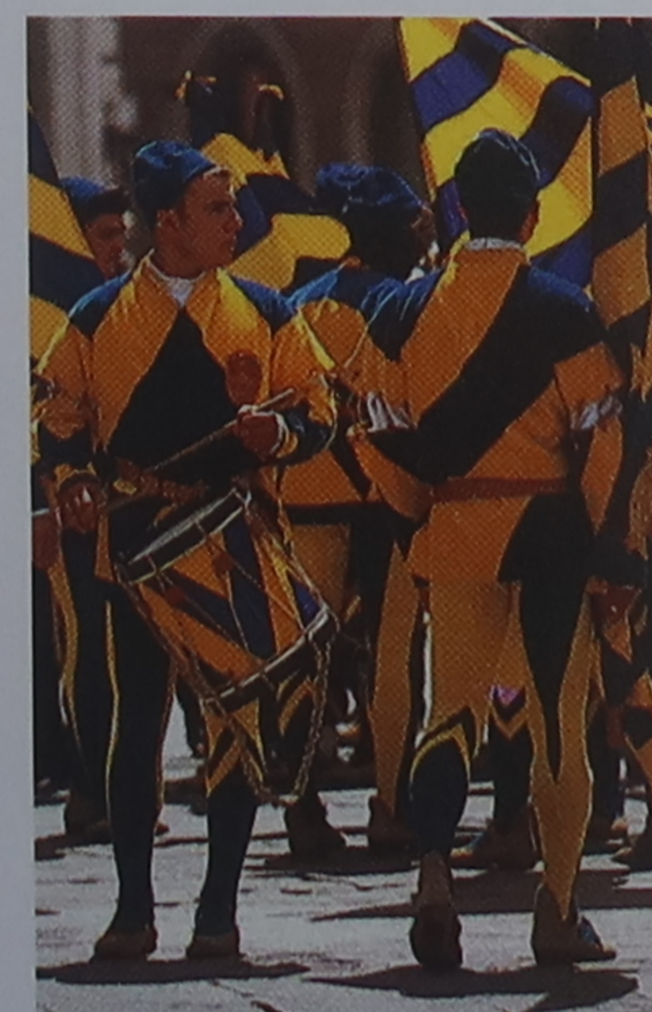
Fête patronale costumée dans les rues de Sienne

Regata di San Ranieri ( 17 juin ), Pise (p. 160-165). Un événement qui propose des régates en costumes et des processions de bateaux décorés sur l'Arno. Le soir, des dizaines de milliers de torches viennent illuminer