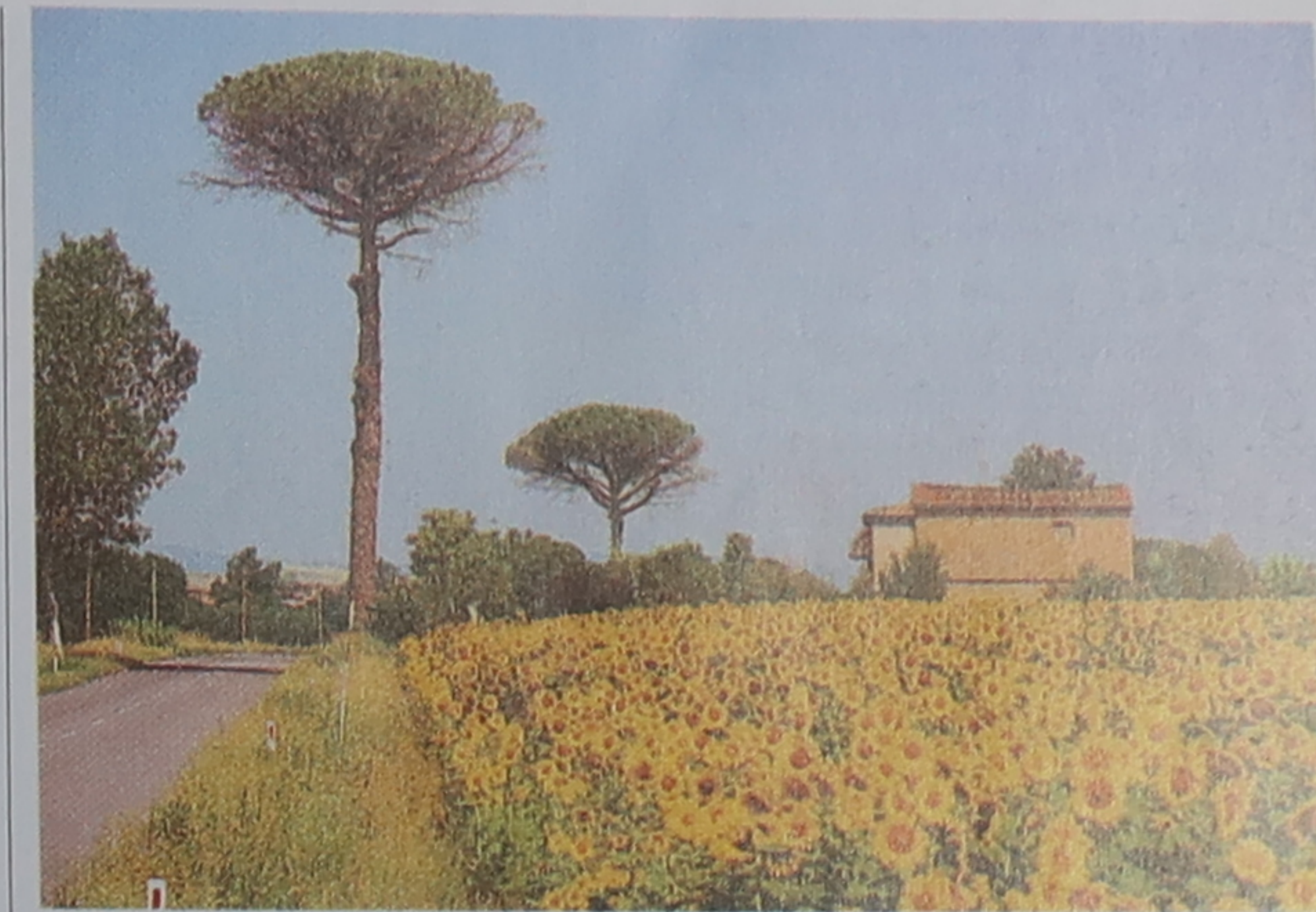
Champ de tournesols dans la campagne toscane, au cœur de l'été

les bâtiments qui bordent les berges du fleuve.