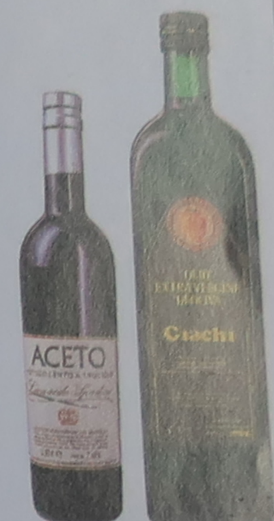
Vinaigre de vin rouge et huile d'olive