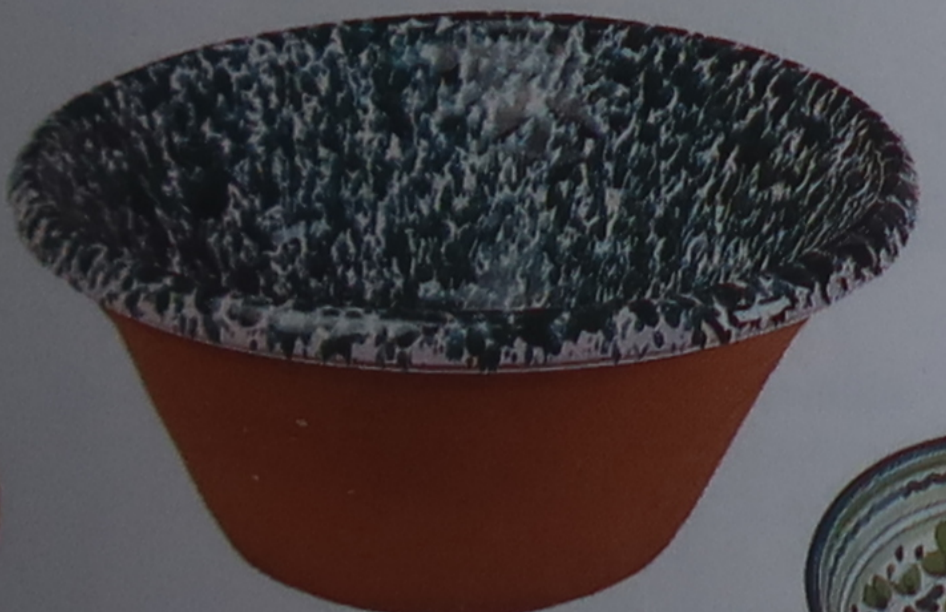
Saladier en céramique