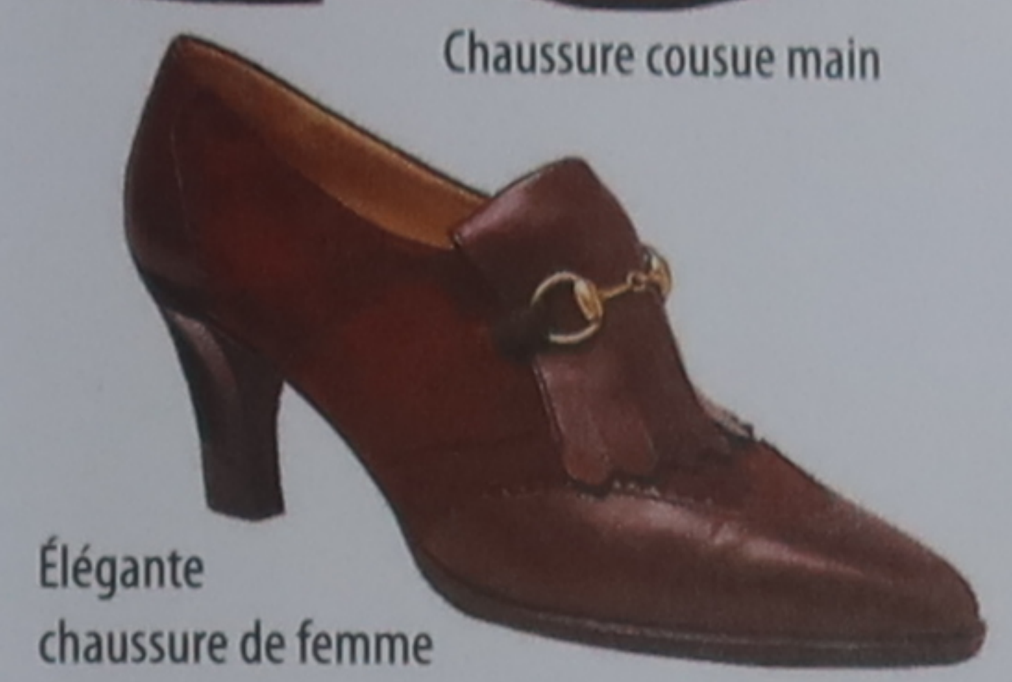
Élégante chaussure de femme