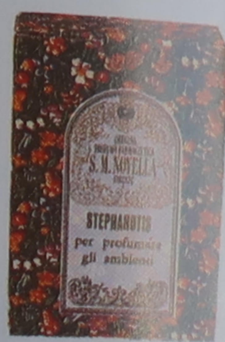
Désodorisant à base de fleurs