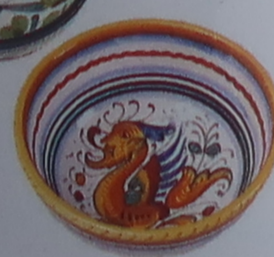
Reproductions de céramiques Renaissance