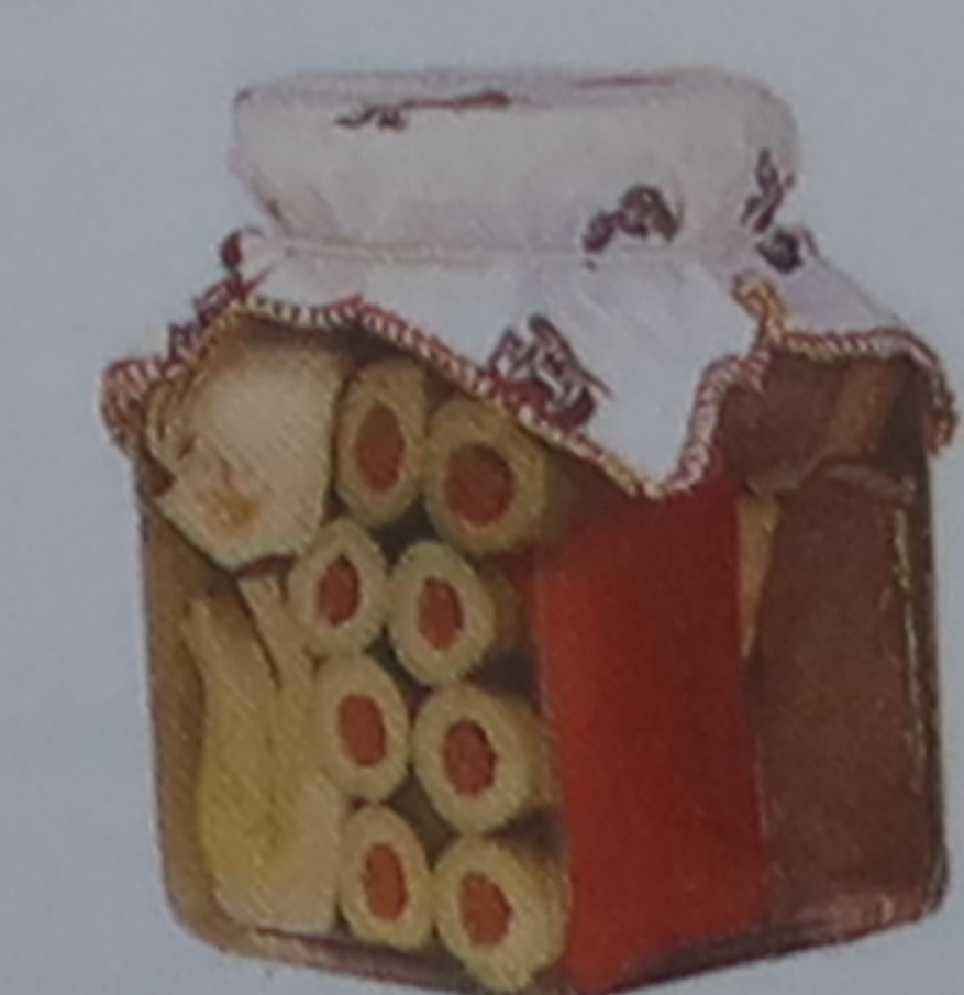
Cœurs d'artichauts aux olives

Dans les alimentari (épicerie) toscanes, les gastronomes apprécieront un large choix de charcuterie locale (en particulier de saucissons), de vins (dont le fameux chianti), d'huiles d'olive (il en existerait 40 variétés), de miels ou encore de confiseries.