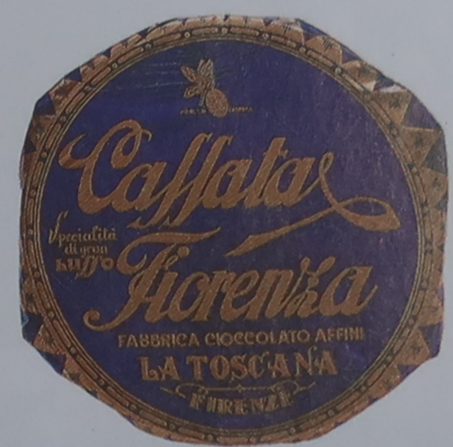
Gâteau au chocolat