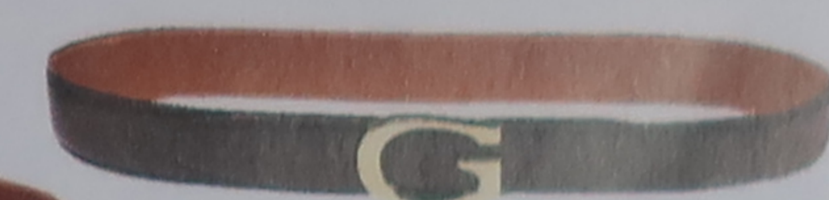
Ceinture signée Gucci