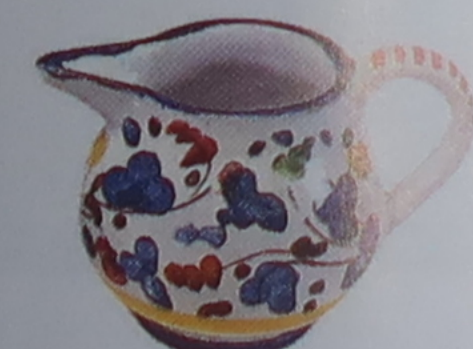
Majolique peinte à la main