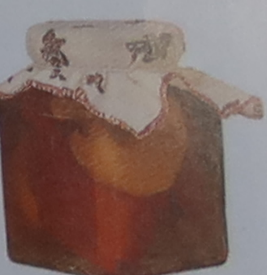
Piments à l'huile d'olive