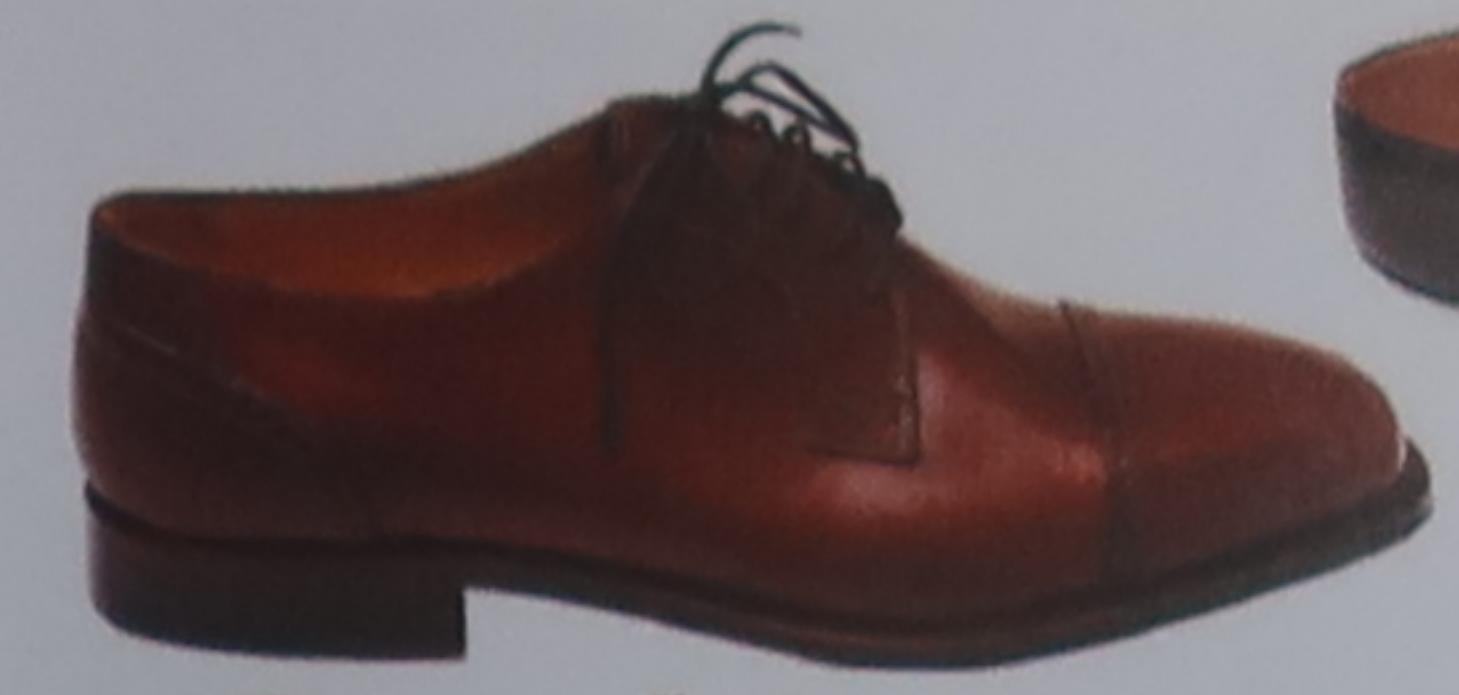
Chaussure cousue main

Les créations de stylistes prestigieux côtoient les imitations vendues dans les rues et sur les marchés.