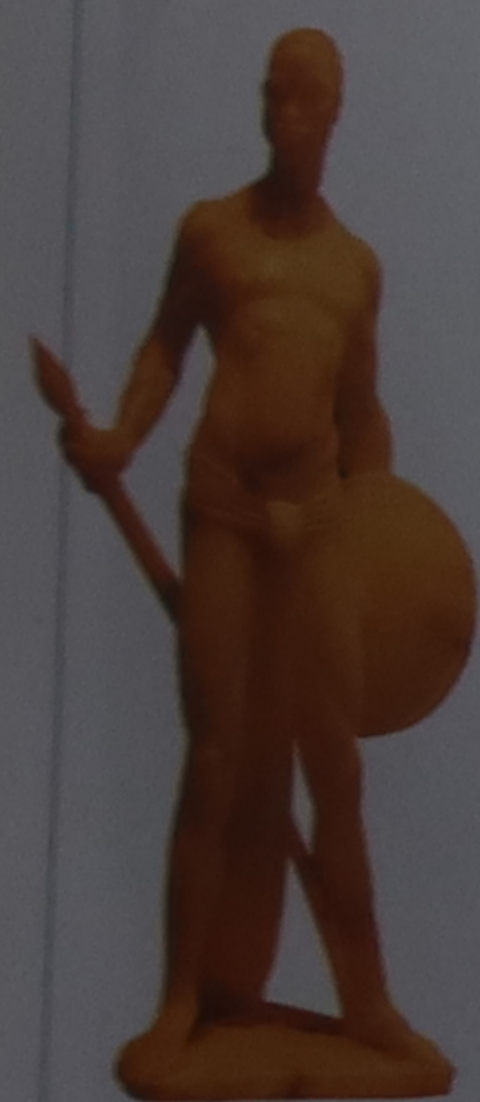
Figurine en albâtre de Volterra

Les pharmacies florentines vendent souvent des produits élaborés à partir de recettes traditionnelles.