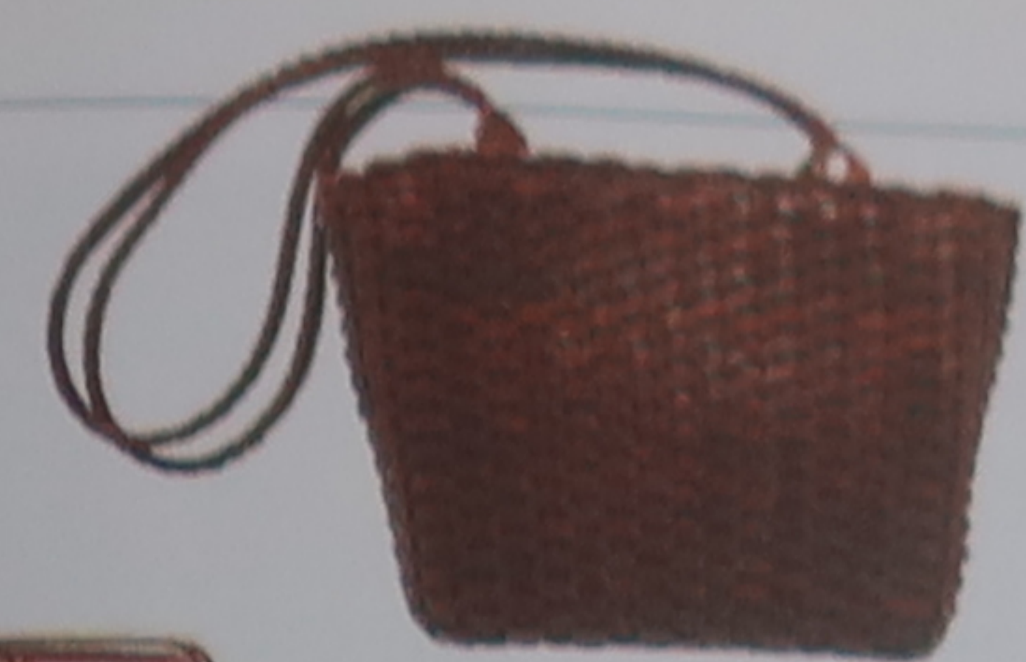
Sac à main ouvragé

Les artisans toscans proposent aussi bien des pièces originales ( artistiche ) que des reproductions d'œuvres de la Renaissance ( reproduzioni ). Vous pourrez également acheter des copies de sculptures.