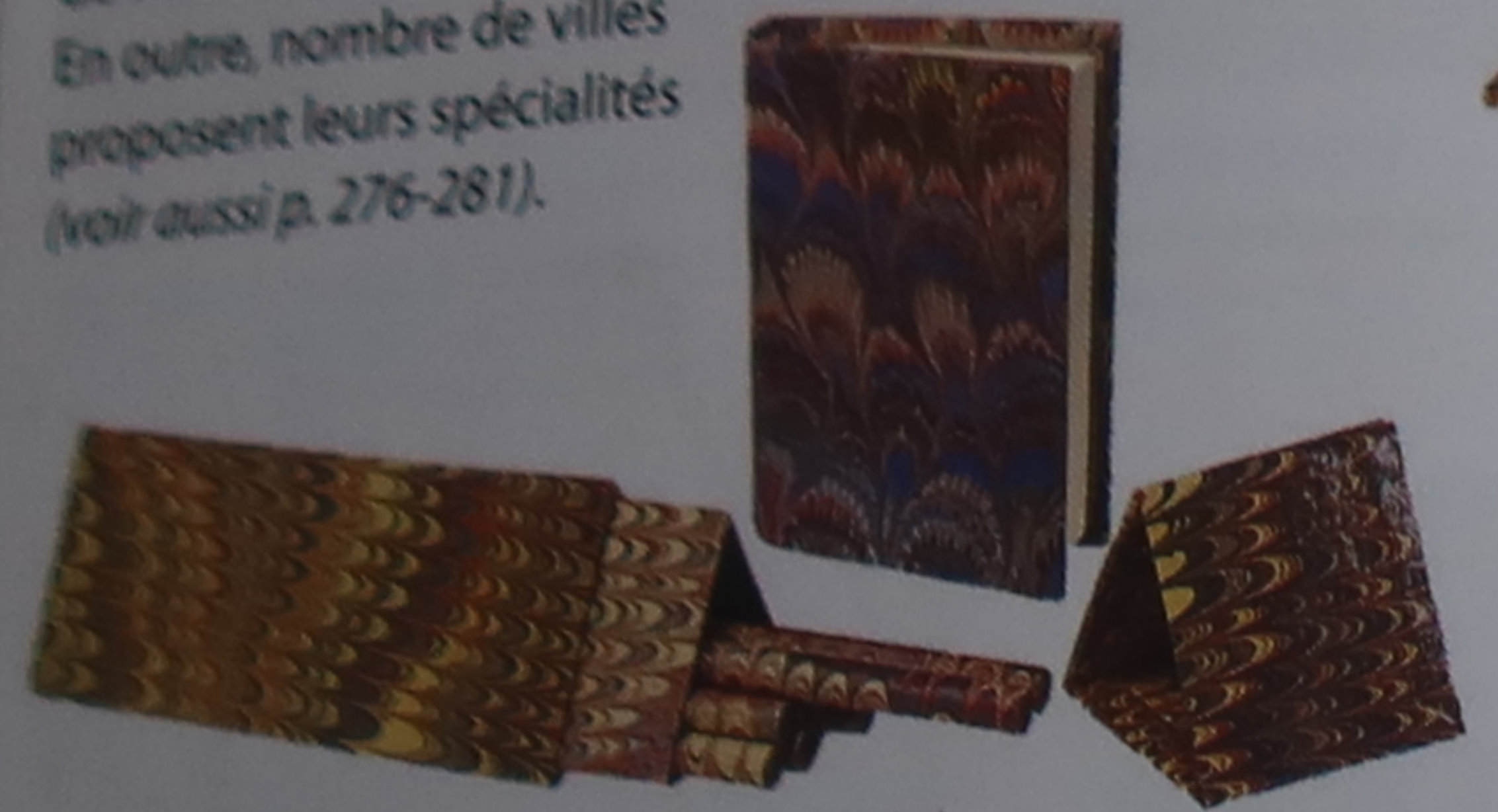
Calepin et boîte de crayons en papier marbré