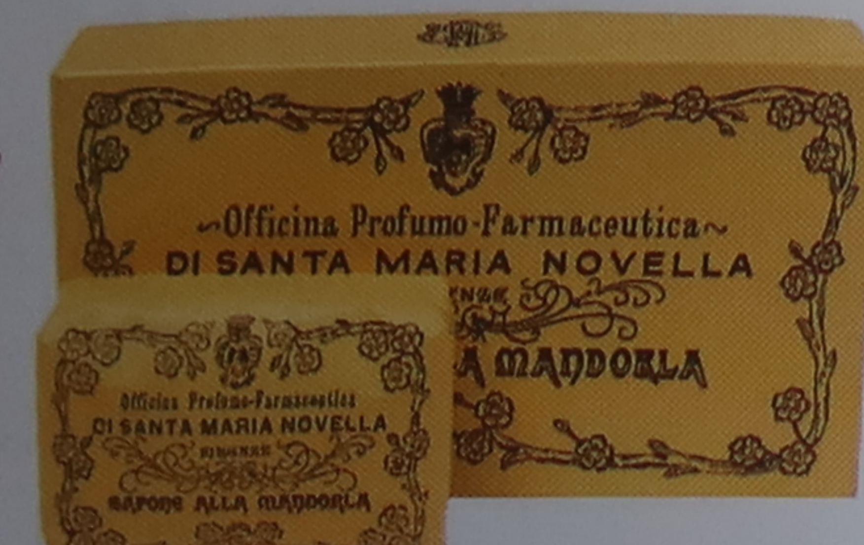
Savon à l'ancienne