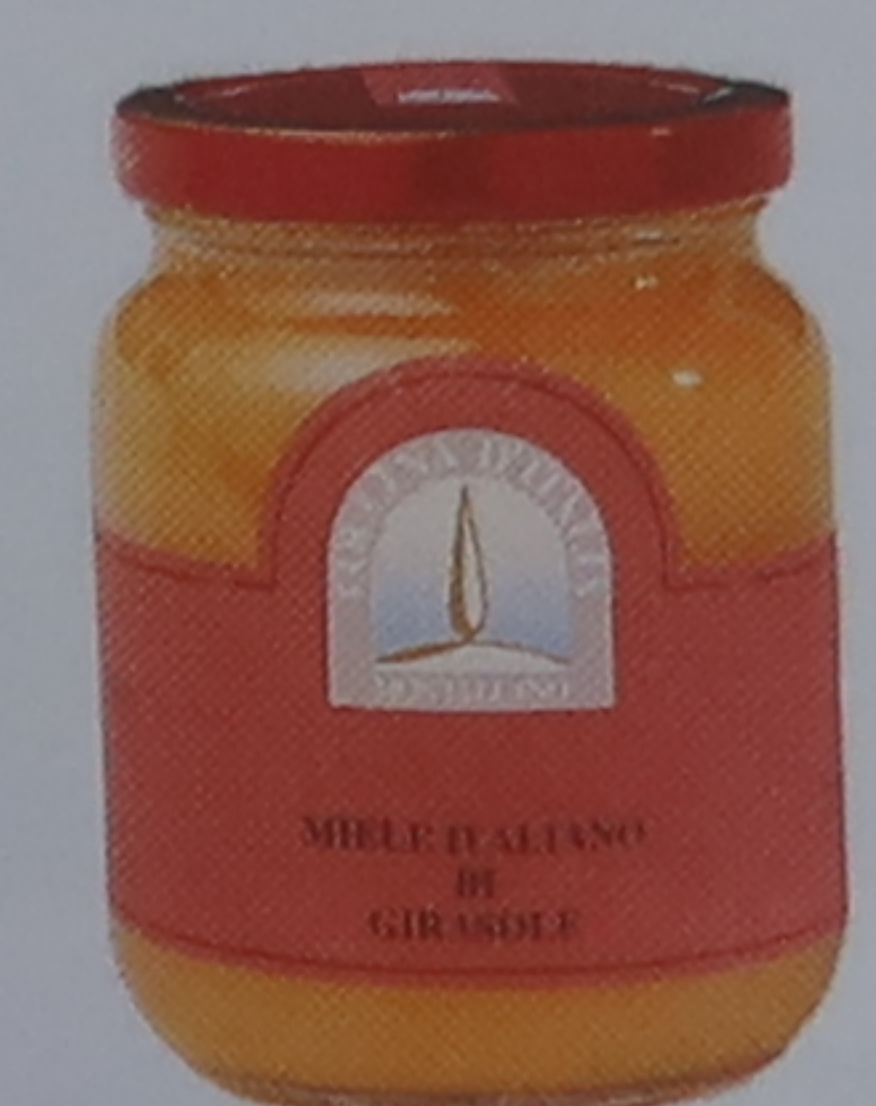
Miel de tournesol de Montalcino

Tous les grands noms de la mode, tels que Gucci, tiennent boutique à Florence.