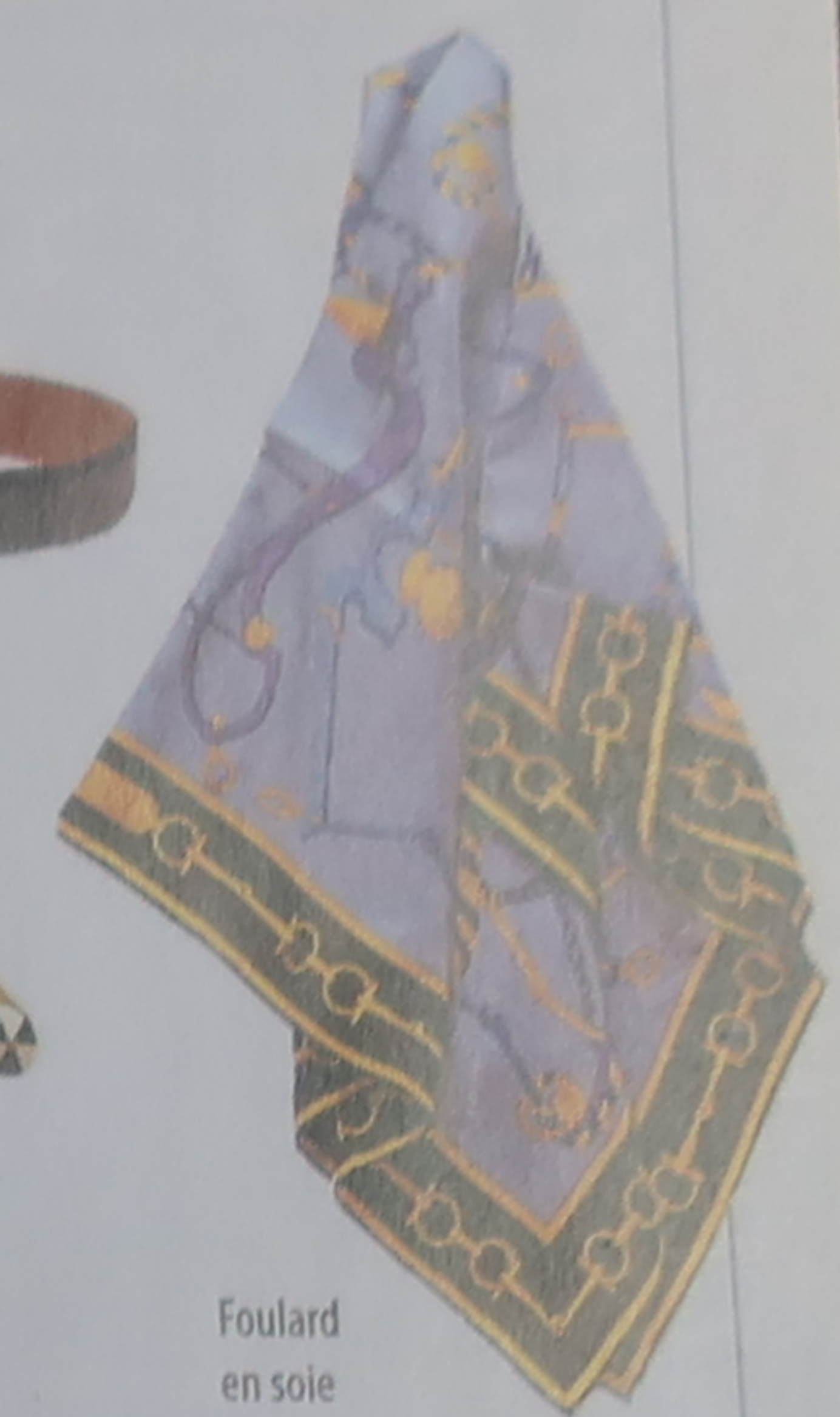
Foulard en soie