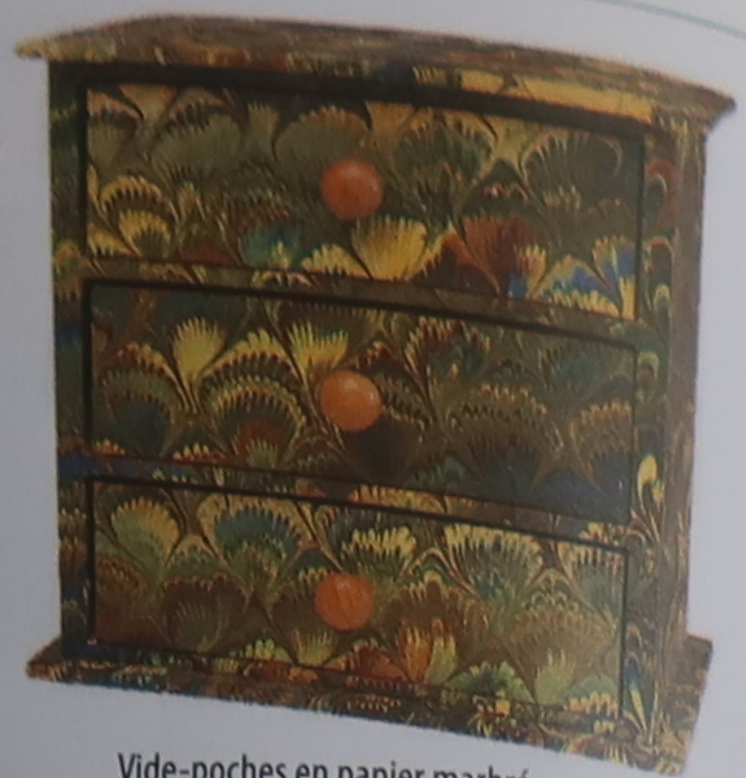
Vide-poches en papier marbré

La haute couture et les antiquités, qui font la réputation de l'Italie du Nord et plus particulièrement de Florence, ne sont pas à la portée de toutes les bourses. Toutefois, vous pourrez acheter chaussures et maroquinerie à des prix intéressants. Dans les magasins ou chez les producteurs, un large éventail de vins, d'huiles d'olive, de miels et de conserves satisfera les fins gourmets. En outre, nombre de villes proposent leurs spécialités (voir aussi p. 276-281).