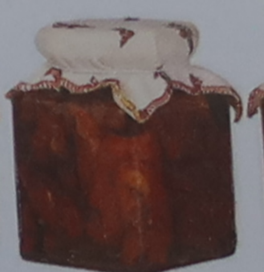
Tomates séchées à l'huile de tournesol