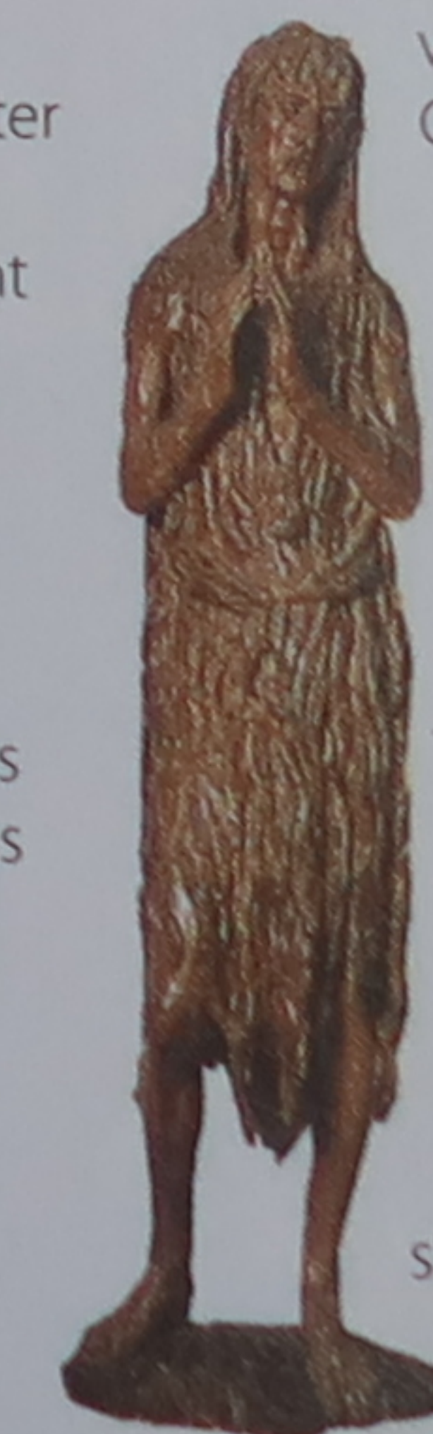
Madeleine (1455), sculpture de Donatello

Cette démarche apparaît très clairement dans la remarquable sculpture où s'expriment à la fois la douleur et le repentir de l'ancienne pécheresse. La quête se poursuivait jusque dans les thèmes les plus traditionnels. Ainsi, dans sa délicate Vierge à l'Enfant (v. 1455-1466), Fra Filippo Lippi (p. 86) s'intéresse davantage à la relation entre la mère et son fils qu'aux éléments strictement religieux du thème.