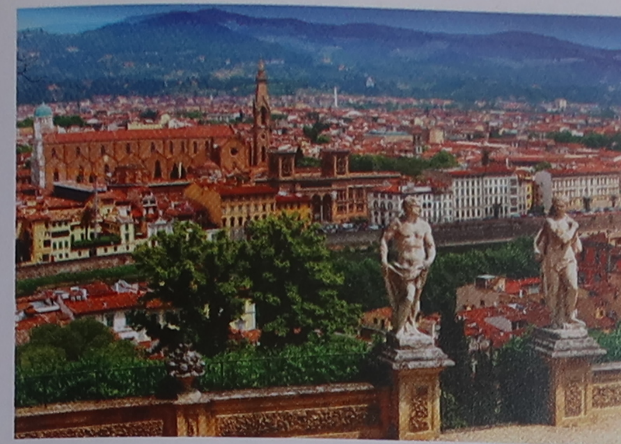
Florence vue depuis la rive sud de l'Arno

Dans l'Oltrarno, une promenade au bord de l'eau offre de belles vues du fleuve, de la ville et des collines qui l'entourent.