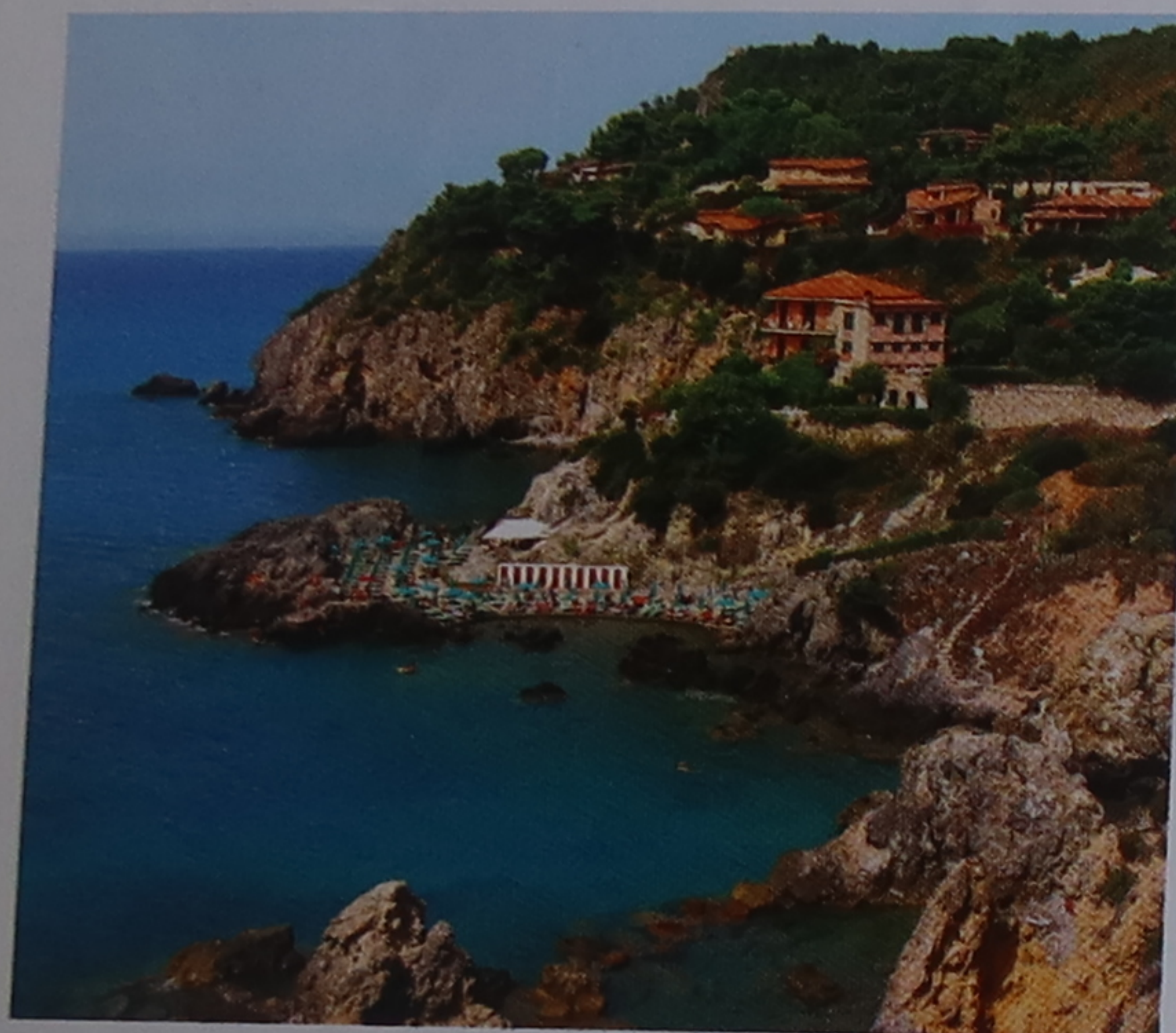
Baie de Talamone

de grands vins ne seront pas en reste avec une escapade dans le Chianti et des étapes de choix à Montepulciano et Montalcino, deux ravissants villages historiques. Enfin, une semaine dans le sud de la Toscane vous permettra de sortir des sentiers battus touristiques pour découvrir le littoral et ses belles îles, ainsi que l'arrière-pays étrusque au riche patrimoine. Ces itinéraires peuvent être enchaînés dans le cadre d'un séjour de trois semaines ou plus, ou simplement servir à puiser de l'inspiration.