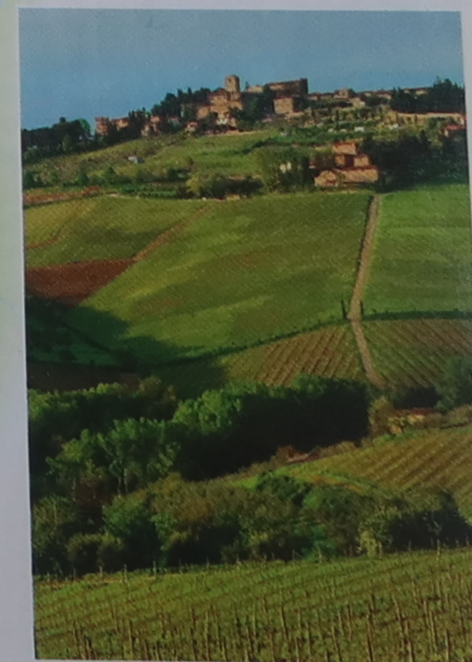
Paysages verdoyants du Chianti

Villages, domaines viticoles et coteaux composent les splendides paysages du Chianti, une région aux crus réputés.