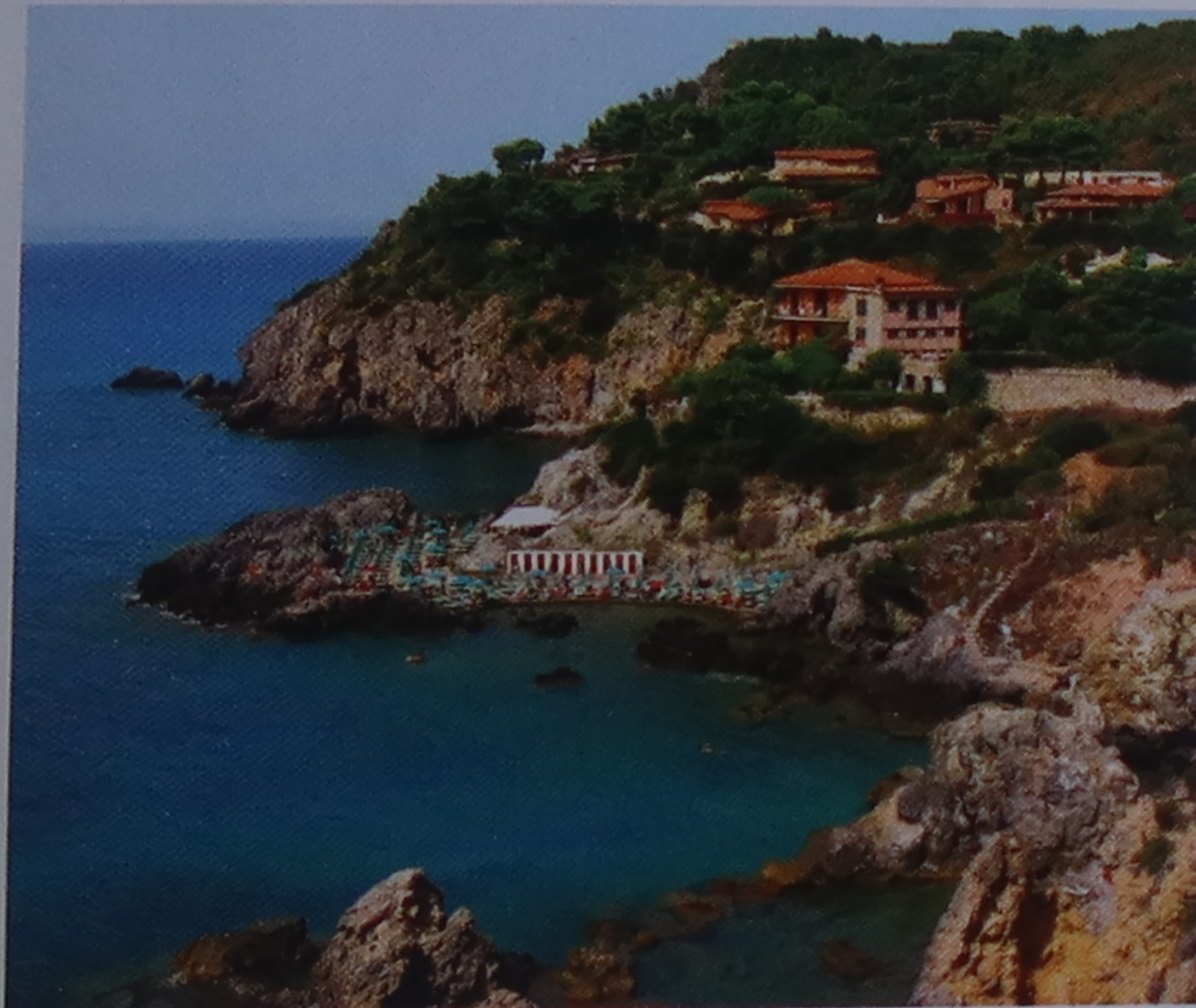
Baie de Talamone

de grands vins ne seront pas en reste avec une escapade dans le Chianti et des étapes de choix à Montepulciano et Montalcino, deux ravissants villages historiques. Enfin, une semaine dans le sud de la Toscane vous permettra de sortir des sentiers battus touristiques pour découvrir le littoral et ses belles îles, ainsi que l'arrière-pays étrusque au riche patrimoine. Ces itinéraires peuvent être enchaînés dans le cadre d'un séjour de trois semaines ou plus, ou simplement servir à puiser de l'inspiration.