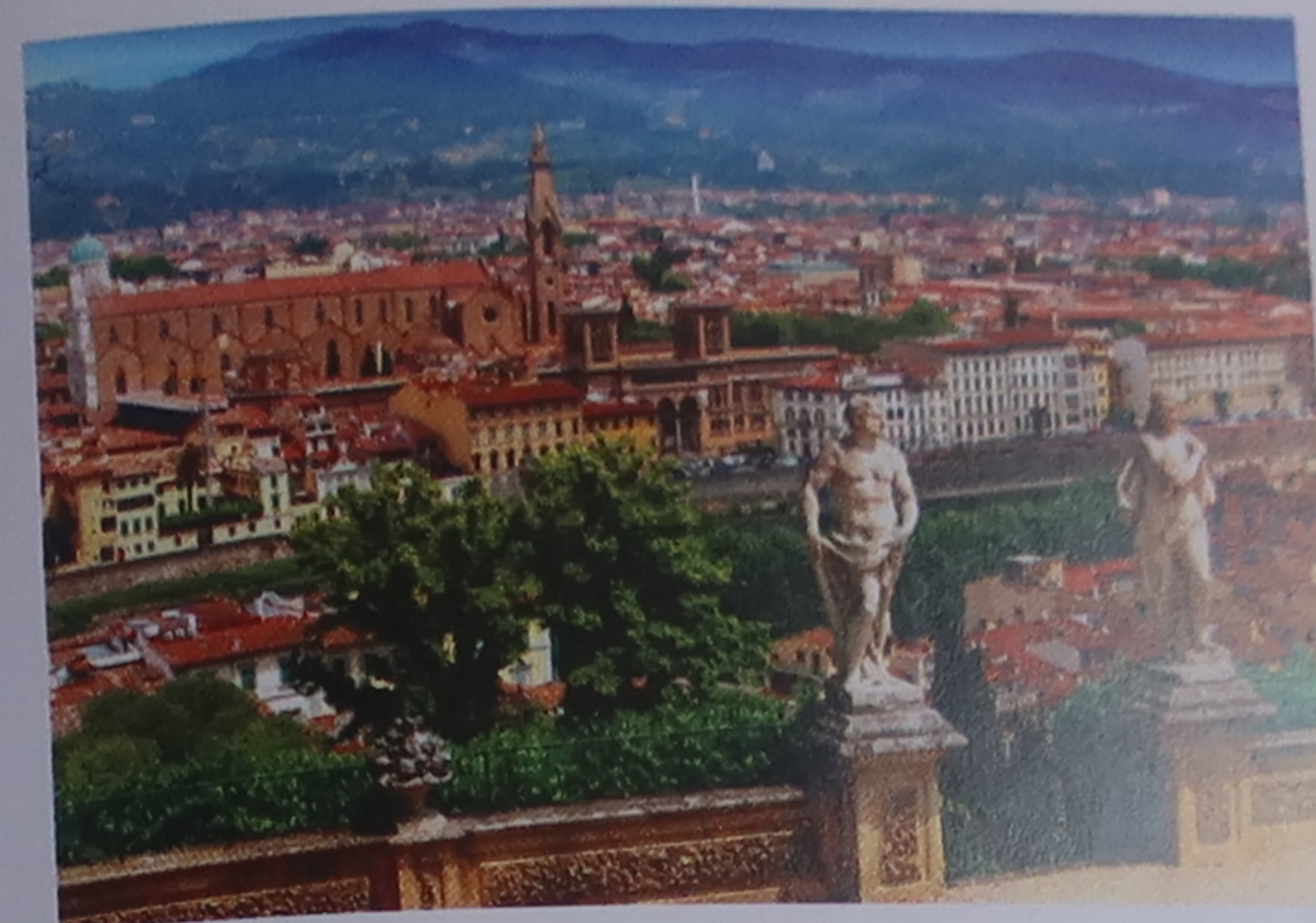
Florence vue depuis la rive sud de l'Arno

Dans l'Oltrarno, une promenade au bord de l'eau offre de belles vues du fleuve, de la ville et des collines qui l'entourent.